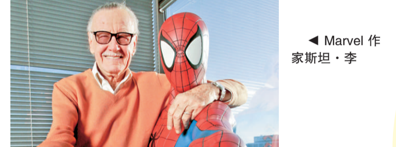
◀ Marvel 作家 斯坦·李