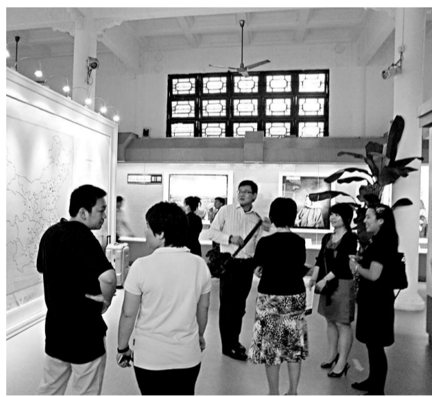
▲觀眾正在參觀展覽 ▲香港天后廟的僧侶