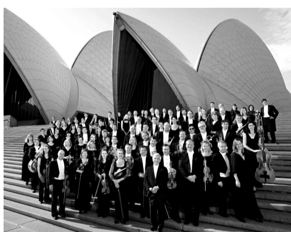
演出 ▲阿殊堅納西指揮悉尼交響樂團 ▲阿殊堅納西與悉尼交響樂團在悉尼歌劇院外合照