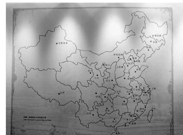
湯姆遜在中國遊歷的路線