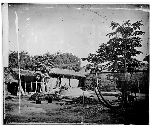
台灣台南平埔族人的居所