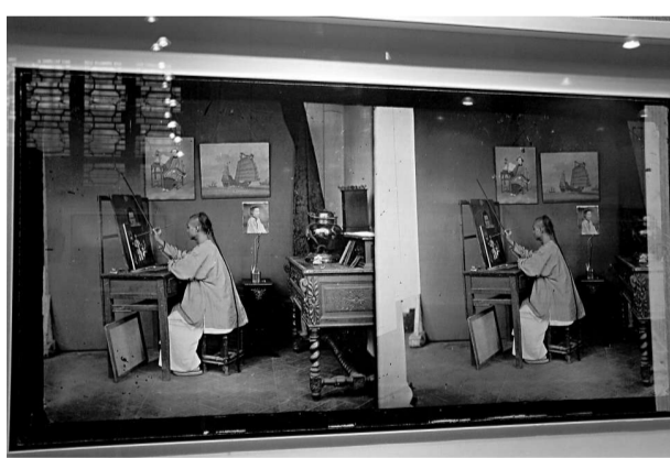
香港畫師。在攝影技術剛發明後，由於沒有放大和色彩技術，香港的畫師業曾一度繁榮