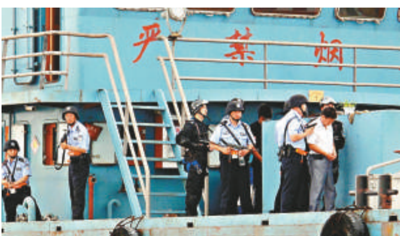
▲快速處置可疑船舶是世博安保重點

現在，滬邊海警已可通過AIS隨時了解可疑船舶的不正常行駛軌跡，查詢可疑船舶的歷史軌跡數據；在特殊敏感區域設置警戒，如果有船舶在警戒區域停留較長時間，就可通知最近的巡邏船趕到現場排查，大大提高了排查準確率和反恐安保效率。