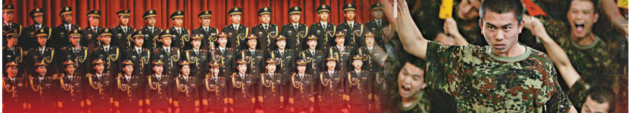
▲《復興之路》與其它大型音樂舞蹈史詩一樣工程浩大 (資料圖片)

獻禮國慶60周年最重要文藝作品——大型音樂舞蹈史詩《復興之路》將於9月23日至10月5日在人民大會堂連演十餘場。由北京奧運會開幕式副總導演張繼剛執導，雲集中國最頂尖藝術家和3200名演職人員的《復興之路》，有潛力成為堪比1966年大型音樂舞蹈史詩《東方紅》的紅色新經典。