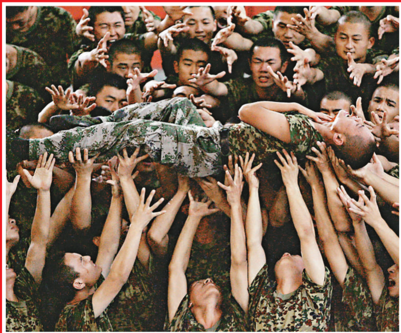
▲正在排練的《復興之路》 (資料圖片)

據了解，為了讓全國人民都能有機會一睹《復興之路》的精彩表演，和《東方紅》一樣，《復興之路》將會製成舞台藝術片，並在國慶期間向全國發行。