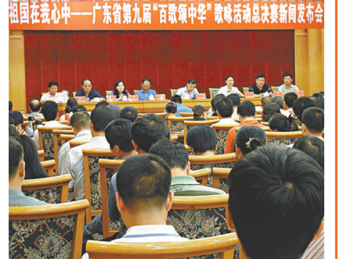
廣東省第九屆「百歌頌中華」歌詠活動新聞發布會現場

【本報訊】記者袁秀賢廣州三日電：廣東省文化廳社會文化處處長陳小明今天在廣州表示，列入中國六十周年重要系列活動之一的「百歌頌中華」歌詠活動，有三千餘支合唱隊報名參賽，參加合唱與獨唱的人數合計超過十五萬人，其中包括首次參與的港澳隊伍：香港華僑華人總會合唱團、澳門公務員合唱團。活動自今年四月開始，報名參賽隊伍逾三千支（包括香港華僑華人合唱團、澳門公務員合唱團），合唱總人數逾十四萬人，歌手七千六百八十七人，無論是參賽隊伍還是參賽人數均為歷屆之最。活動內容豐富，不乏富有地方特色的合唱隊登台亮相。如韶關市乳源瑤族自治縣的瑤族合唱團，其風格迥異、原汁原味的原生态合唱風格，便很有特色。此次「百歌頌中華」歌唱比賽的評委也是極具分量的，其中有：總政歌劇團藝術指導、著名作曲家，歌曲《小草》的作者王祖皆；中國音協副主席、著名作曲家，《長江之歌》的作者王世光；中國合唱聯盟副主席、上海歌劇院首席指揮曹丁；中國音協副主席、上海音協主席、著名作曲家，歌曲《祖國，慈祥的母親》的作者陸在易，解放軍藝術學院音樂系主任、著名歌唱家李雙江等。「百歌頌中華」將於本月六日至十三日在廣東電視台進行總決賽。本月二十八日晚八時，「廣東省第九屆百歌頌中華頒獎晚會」將在中山紀念堂舉行。