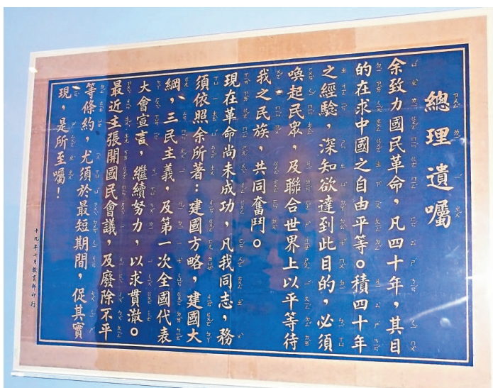
中山陵的陵墓設計呈鐘形 (本報攝) 孫中山的「總理遺囑」在民國時期被廣泛傳播 (本報攝)

展覽亦展出孫中山外孫女戴成功抄錄其父戴恩賽寫給妻子孫婉的一封信，寫於一九二五年三月十一日孫中山去世前一日，記錄了孫中山的病情惡劣，整晚不適，醫生說他已捱不到一天。這些信箋都用筆塗上黑邊，以示哀悼。展覽中大部分圖片均來自南京孫中山紀念館，記錄了孫中山於一九二四年，應軍閥馮玉祥之邀北上共商國事。然孫中山到達天津後即病倒，經協和醫院診治，確診為肝癌，雖經中西名醫多方治療，終究回天乏術，一九二五年三月十二日在鐵獅子胡同行館與世長辭。孫中山逝世後，靈柩