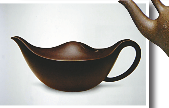
▲萬亞鈞《華誕提樑壺》 ▲陳國宏《和諧濤聲壺》 ▲呂俊傑《陰陽太極壺》