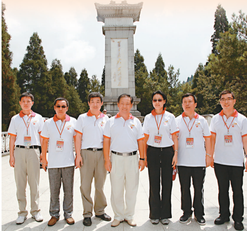
▲中聯辦領導參觀黃洋界紀念碑