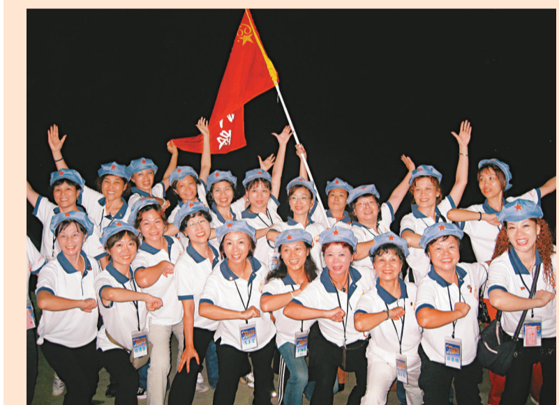
▲專列團成員在實景劇場戴軍帽合影