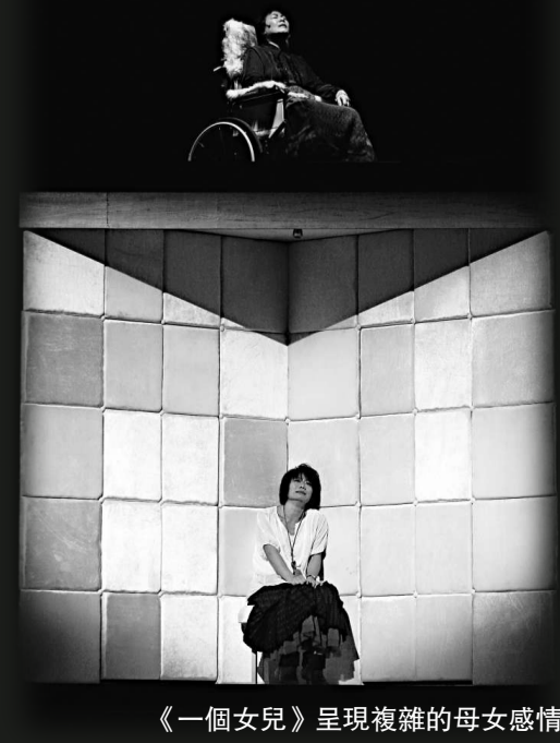
《一個女兒》呈現複雜的母女感情