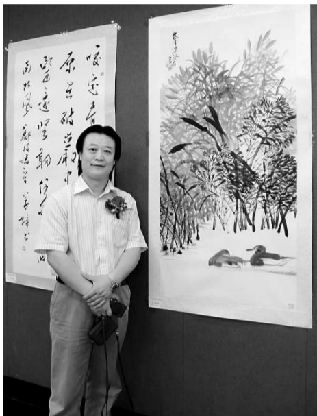
▲書畫家巨石攝於作品（右）前