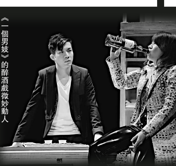
《一個男妓》的醉酒戲微妙動人

至於《影》的故事敘述手法亦相當複雜，全劇由《一個爸爸》、《一個男妓》和《一個女兒》這三個跟「人面對死亡」有關的故事組成，但這三個故事並非講完第一個故事後便接