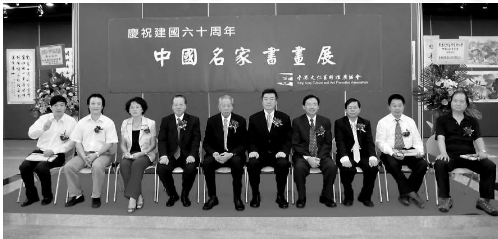
▲眾嘉賓主持「中國名家書畫展」揭幕式