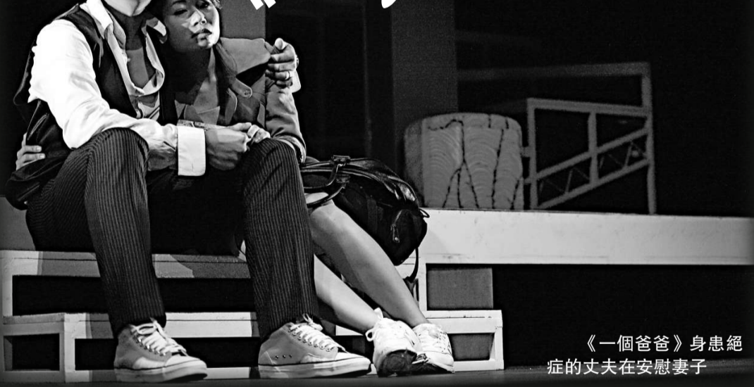
《一個爸爸》身患絕症的丈夫在安慰妻子

觀眾甫入葵青劇院演藝廳，即見到舞台設計師邵偉敏為 Michael Cristofer 編劇、黃龍斌與伍潔茵導演的《影子盒》設計了一個非常龐大及結構複雜的布景。到風車草劇團正式演出時就更令人驚訝，原來這個不會轉動的布景可以分割成六、七個演區；布景的特色包括：用布景框和走廊把演員設定在近觀眾處或舞台深處演出，讓演員在懸於半空的斜路和樓高約兩、三層的高台上表演，把演員置身在像洞穴的幾何圖案內……等巧妙構思。