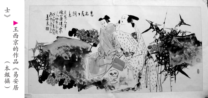
王西京的作品《易安居》