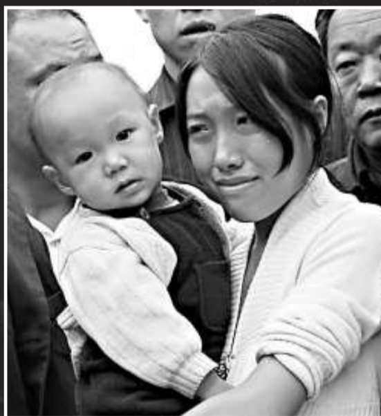
▲礦難家屬在遇險人員登記處焦急痛苦中地等待救援消息

在這篇博文裡，他揭露了僅在今年1至7月份平頂山發生被官方瞞報的四起礦難。四起礦難中共有14人死亡，博文裡提供了死亡者的身份和家庭住址，以證實文章的真實性。 博文引用一位知情人的話說，平頂山市煤礦事故之所以頻頻發生，與當地政府部門監管不力和默許縱容事故瞞報有直接關係，每一起礦難的背後都隱藏着官煤勾結的影子和腐敗現象。 具有諷刺意味的是，在這位網友揭露平頂山瞞報礦難現象六天後，又發生了今日這起大礦難。