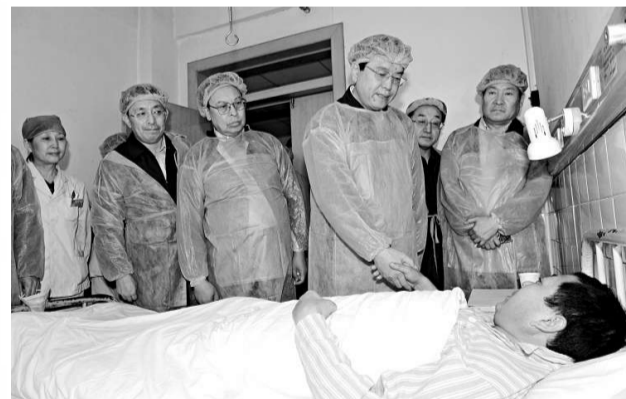
張德江到醫院看望受傷礦工

平頂山市已召開緊急會議，對全市157個礦井全部停產整頓。最新消息指，受巷道塌方嚴重影響，加之巷道受損變窄，河南平頂山礦難救援總體進展較慢，四十四名被困礦工至今仍未下落不明。