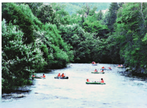
森林生態漂流