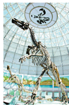
嘉蔭恐龍博物館完整的母子龍化石

伊春地質景觀獨特，小興安嶺經過億萬年的地質變遷，在大森林中形成了千姿百態的奇石怪石，並且在嘉蔭縣發現了埋