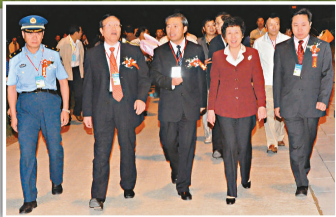
伊春市領導在機場迎接嘉賓。左起：瀋陽空軍司令部副司令員張華山，國家發改委副主任、國家能源局局長張國寶，伊春市委書記許兆君，全國人大常委會副委員長嚴俊琪，伊春市市長王愛文

非節假日旅遊人數增多。今年以來，伊春夏季旅遊不但周末旅遊火爆，其他時間旅遊人數也明顯增多，五營國家森林公園、湯旺河國家公園周末日接待旅遊者最多達2000多人，全市賓館入住率明顯提高，旺季一房難求。