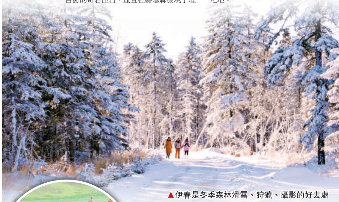
▲伊春是冬季森林滑雪、狩獵、攝影的好去處