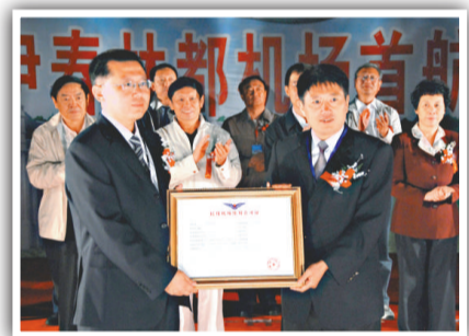
頒發民用機場使用許可證

伊春林都機場是黑龍江省重點工程，納入國家民航「十一五」發展規劃。經過6年前期報批和1年施工建設，2009年8月15日林都機場試飛成功。在短短一年的時間裡，一個具有現代水準和地方特色的新機場建成了，創造了中國在高寒地區一年建一個機場的奇跡。