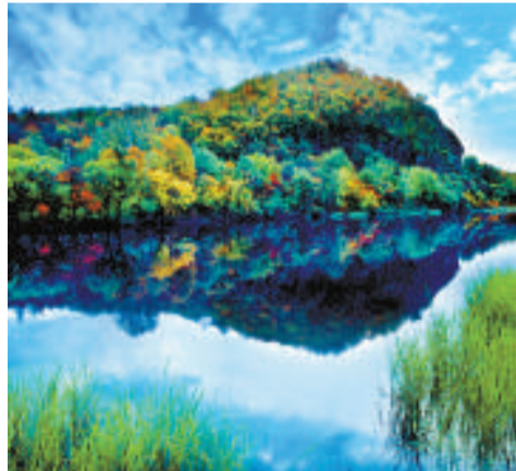
秋季五花山色，層林盡染