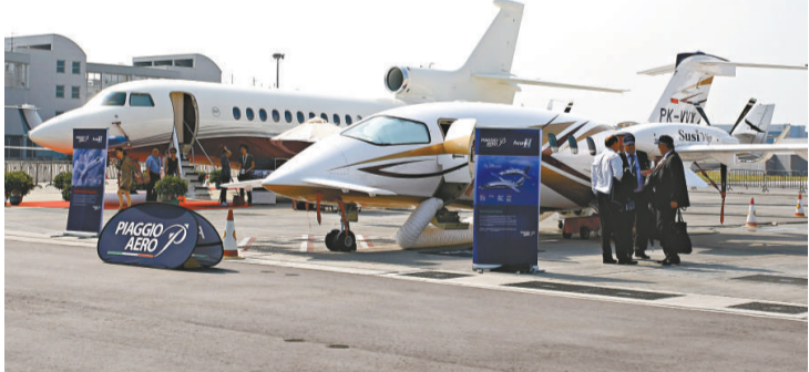
亞洲航空展靜態飛機展示區

務機的模型。據公司亞太區銷售總監多恩透露，目前BBJ型系列飛機訂單有146架，客戶主要來自中東、北美、新西蘭及澳洲。該系列飛機客艙最多達1120平方公尺，設有會議廳及私人辦公室，多恩稱目的是要讓顧客的長途飛行成為「具生產力的旅程」。