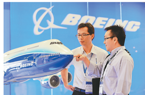
波音787機模型在亞洲航空展陳列

他又透露，從明年6月初開始，該公司將減產777型客機，由每月7架減至5架，但會維持737產量為每月31架。