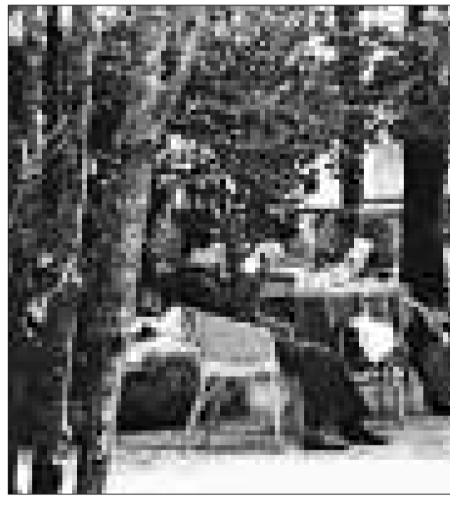
道光十六年,林則徐在署理兩江總督時,他特地将官署移駐清江浦(今淮安市),關心蘇北平原的水利情況。有一次,他接到鹽城地方官送來的呈文,反映當地的一條幹河——皮岔河,日久淤塞,妨礙農耕,急需疏通。爲了切實了解情況,制訂正確的整治方案,林則徐決定親自到交通不便的鹽城,去實地考察。

文化經濟 道光十六年,林則徐在署理兩江總督時,他特地将官署移駐清江浦(今淮安市),關心蘇北平原的水利情況。有一次,他接到鹽城地方官送來的呈文,反映當地的一條幹河——皮岔河,日久淤塞,妨礙農耕,急需疏通。爲了切實了解情況,制訂正確的整治方案,林則徐決定親自到交通不便的鹽城,去實地考察。 於是,他微服輕裝,只帶了一個隨從,悄悄地從清江浦出發,來到淮安。在淮安城郊,僱了一條小木船,自稱是福建客商,因有要事,需去鹽城。說來也巧,這小木船上的船主,正好是鹽城人。見這位客商,和藹可親,就在閒聊中,把當地的民俗風情,一一詳告。林則徐通過和船主的交談,了解