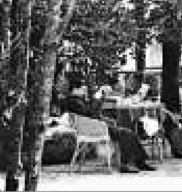
十月三十一日上午,六十歲的毛澤東在羅瑞卿、滕代遠和黃委會主任王化雲陪同下驅車來到鄭州邙山,徒步登上小頂山,俯瞰一望無際的滔滔黃河,毛澤東心旌浮動,滿懷崇敬地對陪同人員說:「我們不能輕視黃河,輕視黃河就是輕視中華民族。要把黃河的事情辦好!」毛澤東還對王化雲笑道:「你的名字起得好哇,半年化雲,半年化雨!」此時居住在小頂山邊的農婦劉氏認出了主席,就吐着膽子上前問毛澤東:「毛主席,你來了,斯大林咋沒來呀?」當時中蘇關係如親兄弟,所以不識字的農婦認為斯大林和毛澤東是在一起的。毛澤東和眾人聽罷哈哈大笑,連忙擺手劉大娘手說:「斯大林比我忙,路也遠,這次沒來,下次我和他一塊兒來看您吧!」