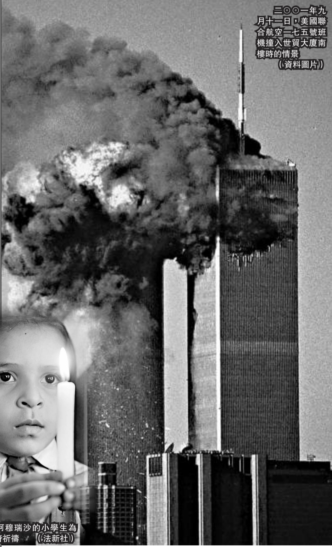
三〇〇一年九月十一日，美國聯合航空一七五號班機撞入世貿大廈南樓時的情景 (資料圖片)

美國的官員們還注意到，「基地」已轉化成一個由多個「掛名」恐怖分子小組所形成的網絡。這個網絡跨越亞洲、中東及非洲，尤其是在局勢不穩的國家如也門及索馬里站穩腳跟。