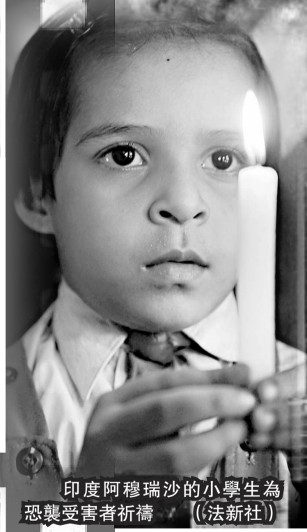
印度阿穆瑞沙的小學生為恐襲受害者祈禱

雖然美國政府警告，「基地」的威脅仍然存在，但公眾已對迄今導致五千多名美國人死亡的伊拉克及阿富汗戰爭感到厭倦。近日的調查顯示，公眾對阿富汗戰事的支持度開始下降。