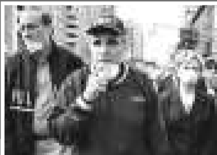
朱利亞尼 (時任紐約市長)

法恩是紐約 Intercapital Planning 公司的職員。世貿中心倒塌後，大量灰塵散布附近一帶，法恩當時滿身是塵，緊緊抓住公事包的樣子，被一名記者拍到，使他成為經典照片的人物。現時的法恩表示已不再時時回憶「九一一」的情景，以免它成為人生中的陰影。