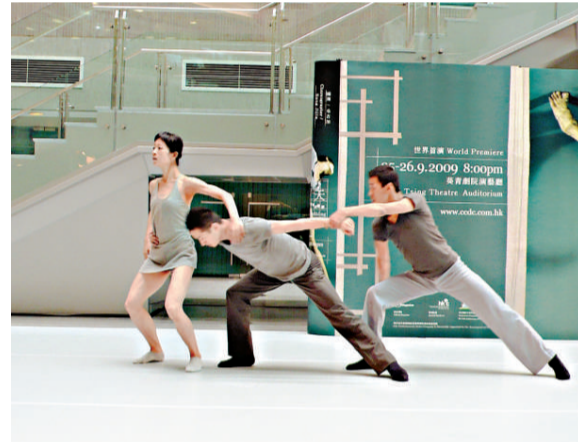
▲城當舞者演出《那一年·這一天》的片段