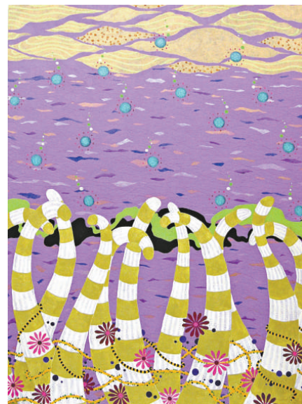
賴雅如作品《Tale of tails》