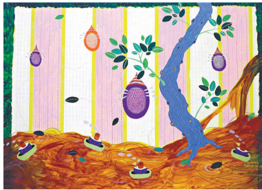
賴雅如作品《Love in cholera》