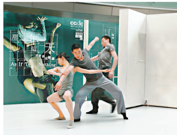
▲城當舞者演出的片段，表達出三人的情感連繫