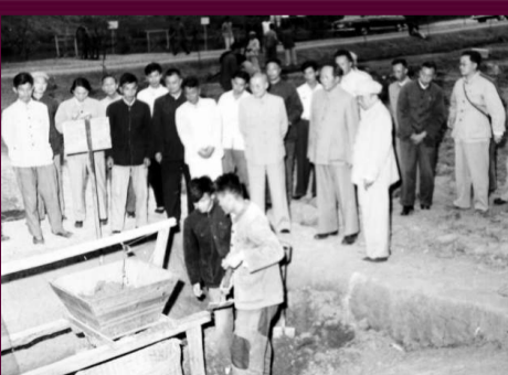
張治中陪同毛澤東在安徽視察農具展