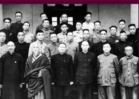
1953年身為西北行政委員會副主席的張治中在青海考察

新疆和平解放後，憑着對新疆的了解，張治中寫成數千字的書面意見給毛澤東，除介紹新疆情況外，並就今後長治久安之計提出六項重要意見，引起毛澤東高度重視。後被派往新疆，協助彭德懷擔任西北軍政委員會副主席一職。新中國成立後，他先後四次向毛澤東直諫，除了對新疆事務外，他還在「文革」問題上、台灣問題上等直諫毛澤東，成為唯一敢對毛澤東與蔣介石均多次直諫的人物。