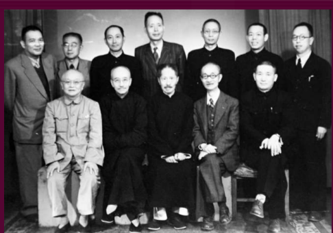
1949年，以張治中為首的國民黨和平談判代表團行前合影