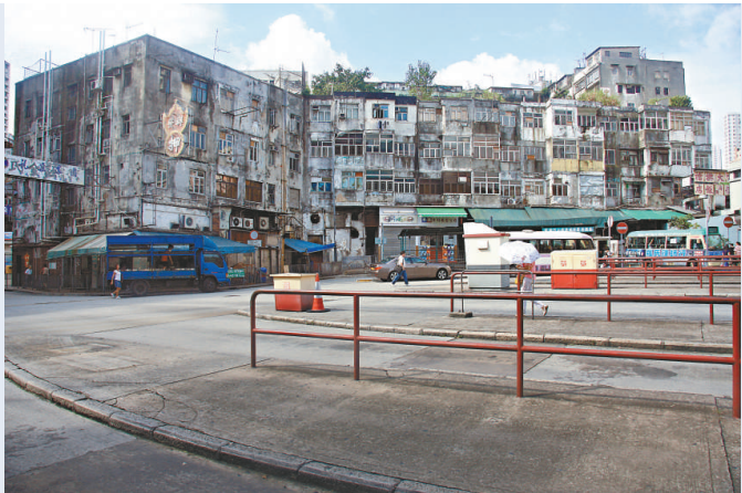
◀▲觀塘裕民坊舊樓居民不滿市建局收購價過低

【本報訊】恒生指數升穿二萬點令人憧憬經濟回暖，而一批觀塘中心的業主亦重申要求市建局提高收購該區重建的樓宇呎價。全港重建聯區業主聯會不滿市建局收購觀塘重建項目五千九百三十七元的呎價過低，指責按近月觀塘一帶的樓宇成交呎價計算，只能購入樓齡超過四十年的舊樓，要求提高收購價。聯會並指責部分長者用作收租的單位呎價，被市建局剋扣至每呎不足四