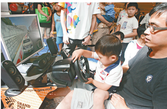
三歲的鄭小朋友在爸爸陪同下試玩模擬賽車，他還說希望長大後能嘗試駕駛真正的賽車（本報攝）

有玩了三次遊戲的小朋友表示，最喜歡看葡京彎路段的賽事，因為很多車手在這個急彎控制不好，就會撞車。他亦說，賽車很刺激但亦很危險，自己年紀尚小，只能通過模擬遊戲感受賽車的速度。