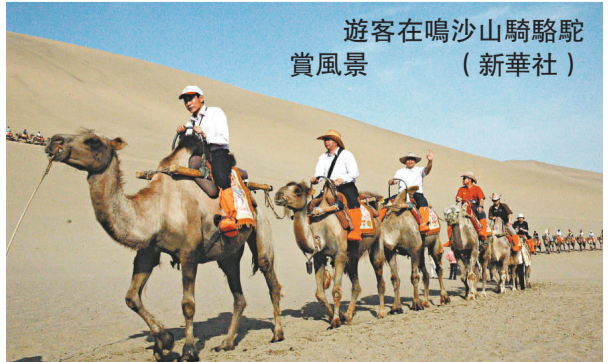
遊客在鳴沙山騎駱駝賞風景

甘肅有著燦爛輝煌的歷史文化遺存，特殊的地質構造也造就了隴原絢麗多彩的自然風光，從奇峰聳立的隴南山