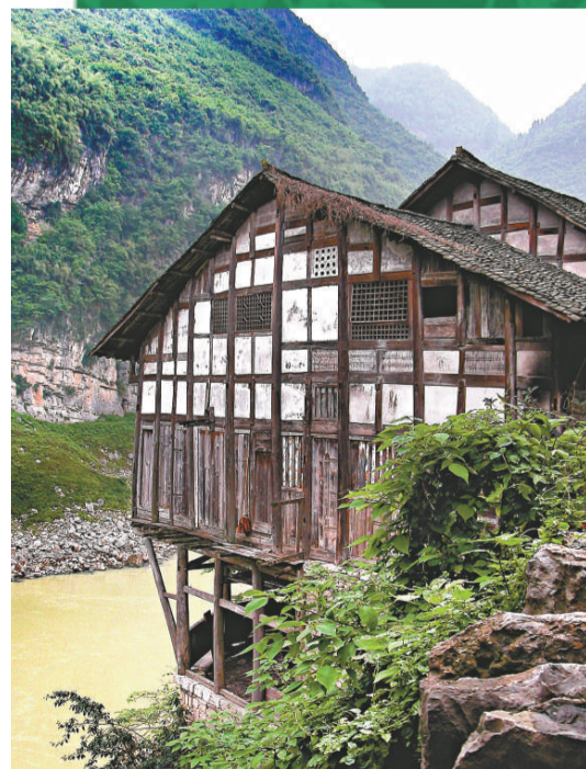
▲龔灘的古街以吊腳樓為特色，臨江而建