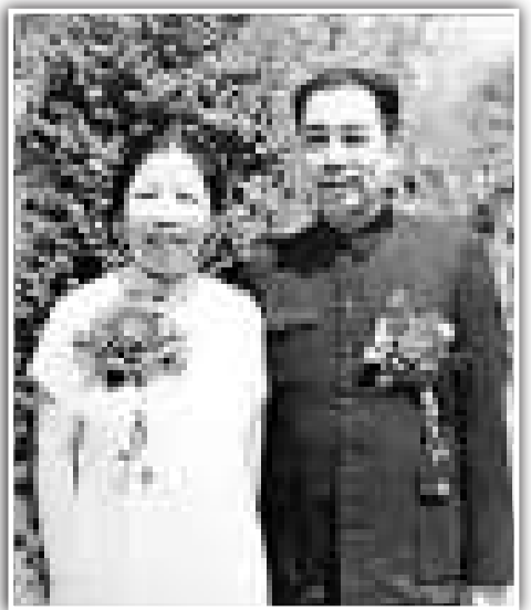
周恩來與鄧穎超，攝於一九五四年