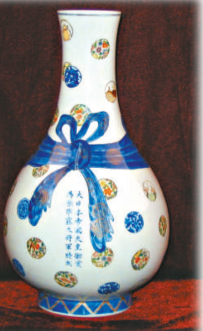
陶瓷工藝品是中國贈送友好國家的禮品之一