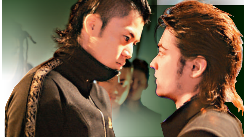
▲小栗旬（右）與山田孝之合演《熱血高校》，對山田大為欣賞