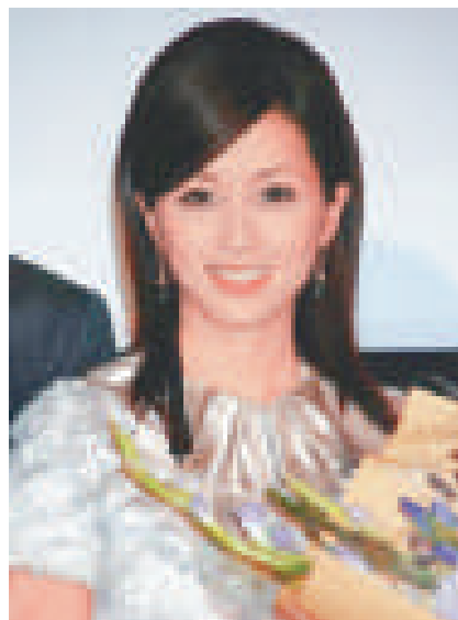
▲雖然酒井法子表示不想保釋，但其繼母和家公等有意為她申請

早前被起訴藏毒的酒井法子，終於在十一日再被檢察廳起訴吸毒罪名。雖然酒井之前表明「不想保釋」，但其家人有可能在下周初為她申請保釋。