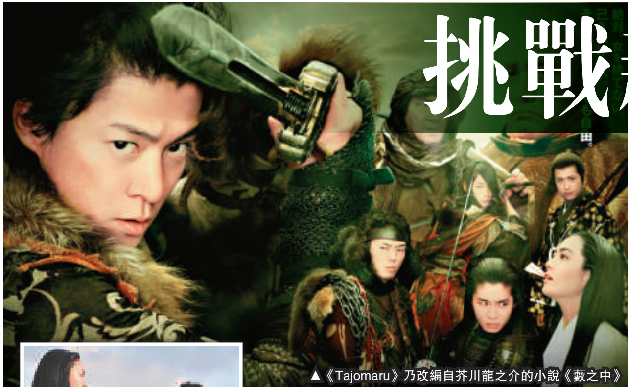
▲《Tajomaru》乃改編自芥川龍之介的小說《藪之中》