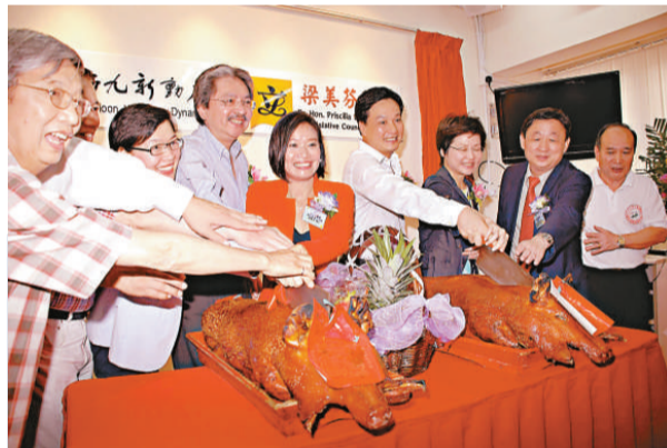
梁美芬（右五）議員辦事處開幕，曾俊華（右六）及林鄭月娥（右三）等官員齊捧場

梁美芬透露，為繼續強化地區服務，年底將在中產人士聚居的長沙灣景匯商場開設另一個辦事處，以更好地服務中產人士。