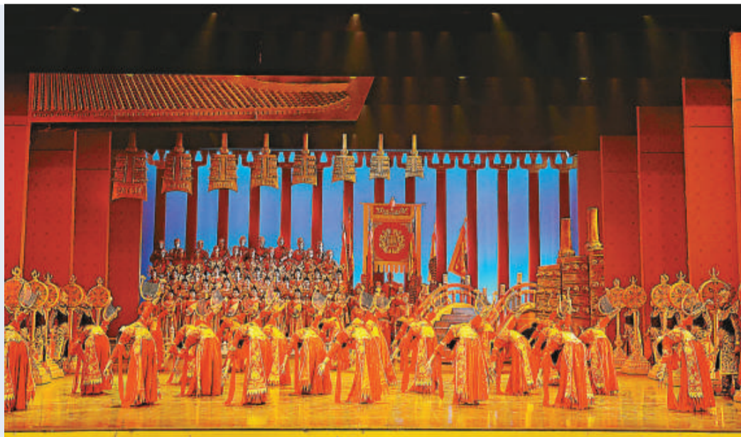
「絲綢之路藝術節」的開幕節目是陝西省歌舞劇院的《大唐賦》

「絲綢之路藝術節」是康文署「世界文化系列」藝術節的第三個藝術節，這個系列的藝術節隔年舉行，之前舉辦過「情迷拉丁藝術節」和「地中海藝術節」，都非常富有地域風情，很受歡迎。今年的「絲綢之路藝術節」承接開創下的特色，節目同樣有突出的民族藝術色彩。表演的藝團主要來自古絲綢之路沿線國家，如格魯吉亞、伊朗、阿塞拜疆、哈薩克斯坦、希臘、印度等，當然也少不了中