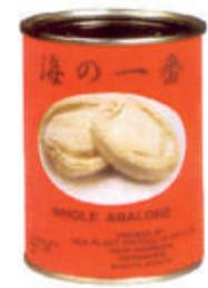
清湯BB鮑魚 隻隻肥嫩