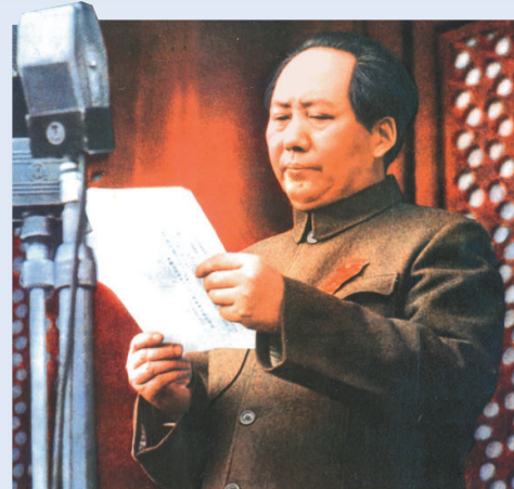
▲1949年10月1日，毛澤東主席向全世界莊嚴宣告：「中華人民共和國中央人民政府今天成立了！」（資料圖片）

湖南省湘潭縣韶山沖人。中國共產黨和中國的主要締造者和領導人，曾任中華人民共和國中央人民政府主席。