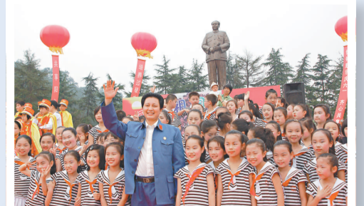
▲孩子們與毛澤東扮演者在銅像廣場合影留念