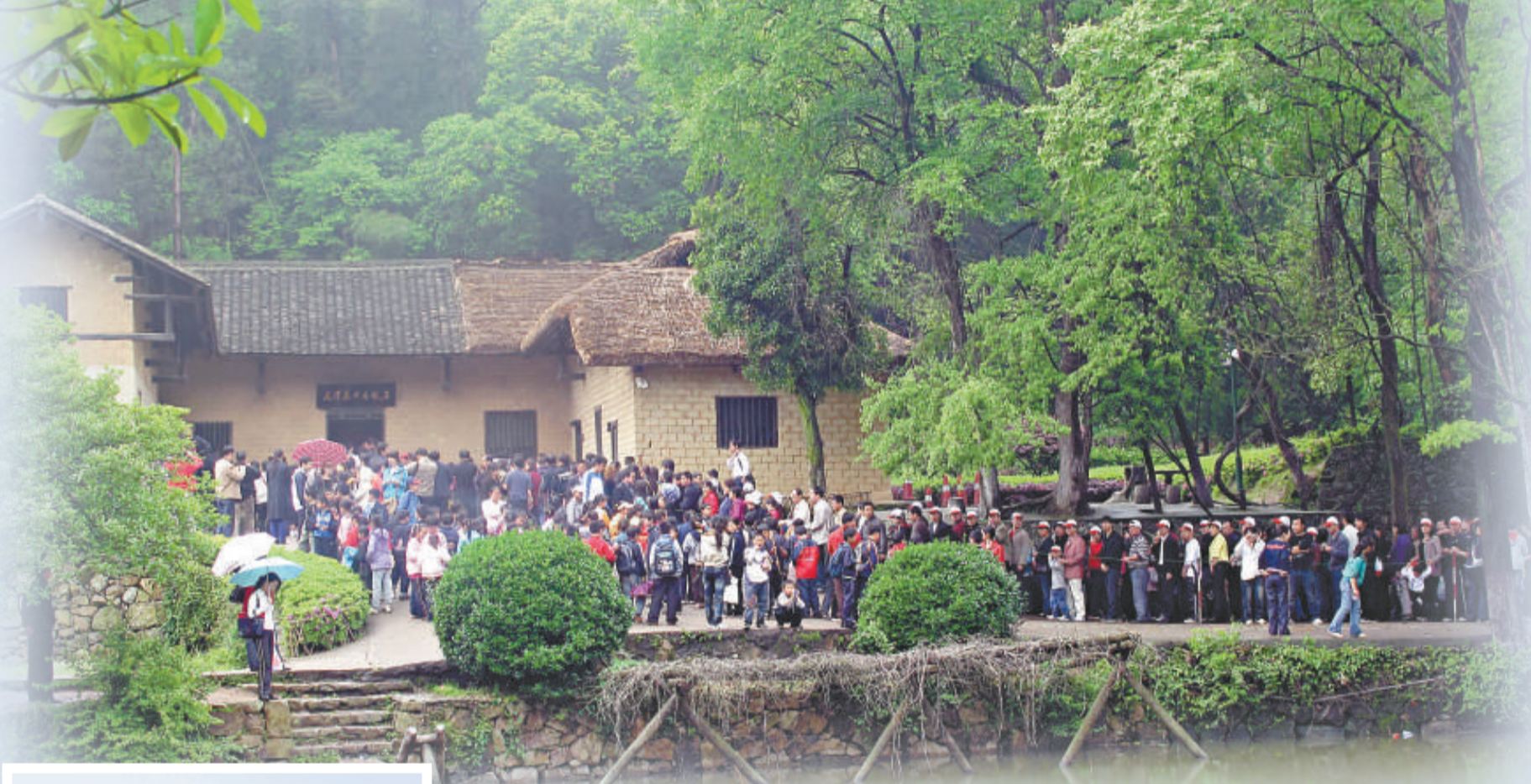
▲前往毛澤東故居參觀的人們每天都是絡繹不絕

對此，韶山市委書記楊廣接受記者採訪時說，毛主席提出「為人民服務」的核心，就是更多更好地提高人民的幸福指數。如今的韶山，在毛主席「為人民服務」思想靈魂的指導下，幹部勤政親民，民衆個個富裕，人人安居樂業，社會穩定和諧。韶山已經實現毛主席老人家曾經「盼鄉親們早日致富」的願望，已經達到小康生活，並逐步向着提高着更多的幸福生活指數方向邁進。