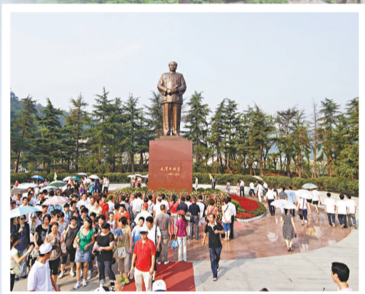
▲新擴建毛澤東銅像廣場每天人流如織