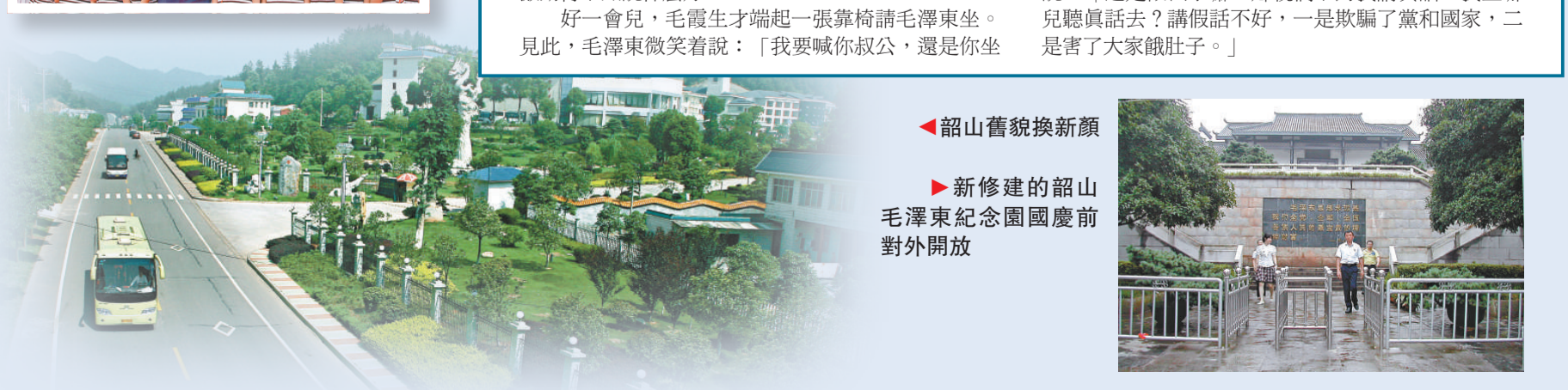
▶新修建的韶山毛澤東紀念園國慶前對外開放