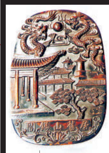
● 硯蓋 硯底 ●