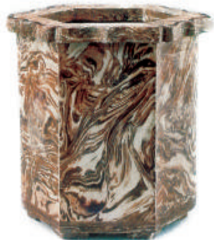
潮乾隆 仿木香花盆 直徑 14 厘米。花盆折沿, 菱花形口, 六方體, 下承六足。通體施木紋釉, 釉色流淌自然。

仿木紋釉的裝飾效果大多清雅怡人, 頗具自然生趣。可以說, 是展示清朝運用釉上彩的想像力以模仿其他材質與誇耀創造能力的最佳典範。因此, 乾隆時期會不惜工本地燒造各種仿生釉瓷器, 除了仿木外, 還有仿竹、仿石、仿古銅器等。不過, 乾隆時期的仿生釉雖能到仿肖逼真, 但從藝術角度來看, 這種一味模仿、拘謹的做法缺乏自己灑脫的韻致, 也將單色釉瓷器的生產引入了歧途。當模仿現實中的顏色與質感, 盡量貼近現實作為藝術品的評價標準時, 當對仿真的追求過於精確時, 也許離追求生動、自然的審美觀念也漸行漸遠了。