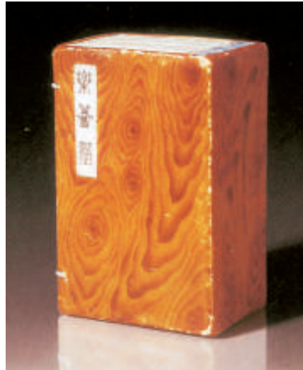
清乾隆 仿木紋釉 「樂善堂」書函式鎮紙

雍正與乾隆朝間, 御窯廠調創出前所未有的多樣色釉及釉上彩設計效果。台北故宮博物院藏一組扳指9枚, 釉色各異, 有仿木、竹、抱子石及大理石紋理, 有的呈現漆器、金銀錯鋼質地, 也有追仿孔雀石和綠松石紋路。雖然絕大部分此