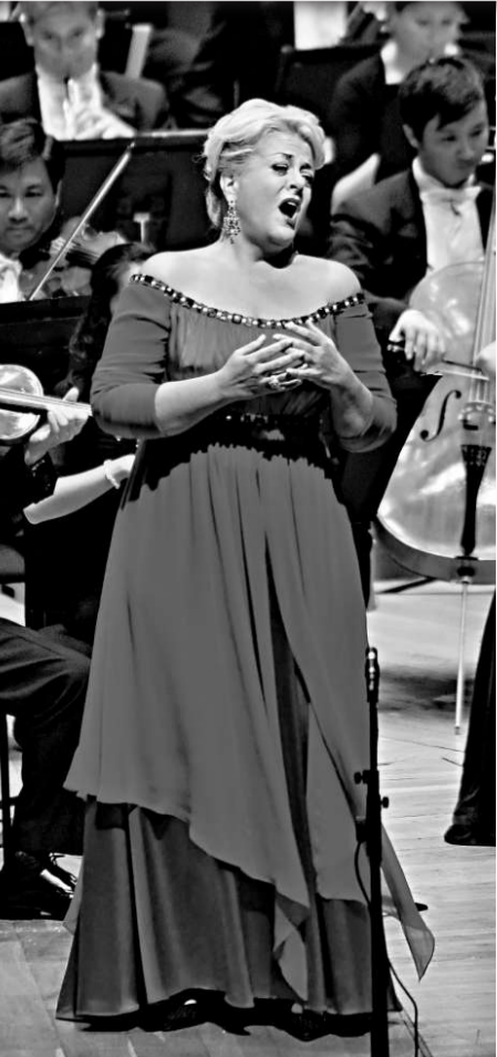
科爾芝胸聲渾厚，運轉靈活，唱出人物性格與感情