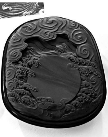
▲《雲瑞硯》的硯石與漆盒都精心巧製，花了三年多時間才完成 (本報攝)