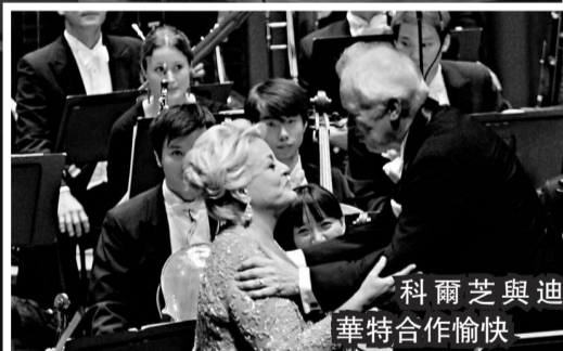
科爾芝與迪華特合作愉快

爲慶祝香港文化中心二十周年，香港管弦樂團2009/2010樂季揭幕音樂會，請來了國際著名戲劇性女高音科爾芝(Deborah Voigt)，她是首次來港演出，九月四日我慕名前往觀賞。指揮艾度·迪華特(Edo de Waart)與科爾芝都是著名的瓦格納、理查·施特勞斯作品最佳演繹者，如此夢幻組合，頗有亮點。現場一聽，果然名不虛傳。