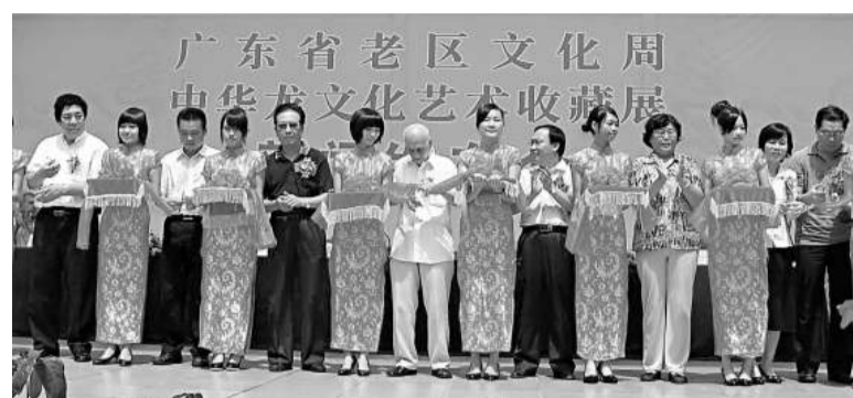
▲嘉賓爲「中華龍文化藝術收藏展」主持開幕禮 (本報攝)

「歛之國寶」歛硯展覽現於紅磡環海街十一號海名軒七樓舉行，展期至九月十六日下午八時，查詢可電二三三二一五三三。