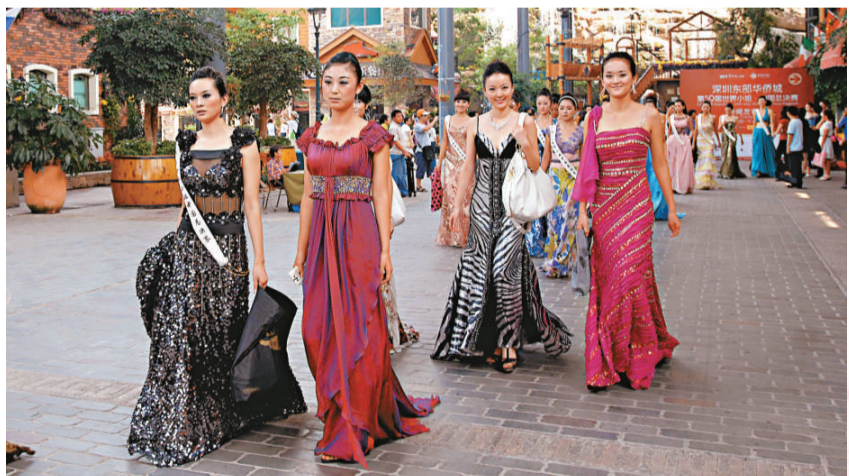
世姐參選佳麗陸續抵達深圳

【本報記者井欽聞深圳十三日電】第59屆世界小姐中國總決賽今天深圳東部華僑城舉辦啓動儀式並公布比賽日程。