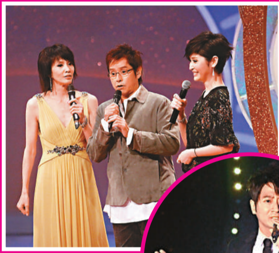
▲鄭裕玲(左)與阿倫鬥嘴令全場觀眾爆笑，右為陳貝兒 ▶孫耀威聲帶有聲堅持演唱精神可嘉