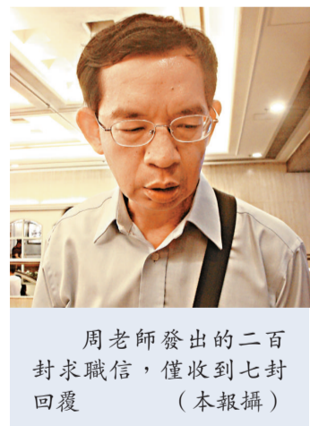
周老師發出的二百封求職信，僅收到七封回覆

教育局發言人表示，已促請個別辦學團體及學校在校內吸納或在屬校調配超額教師，更鼓勵學校以學校津貼或其餘款，創造職位來聘任過剩教師。