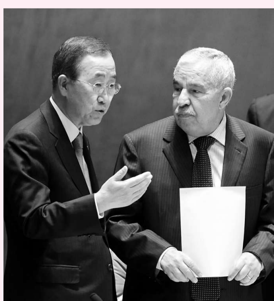
聯合國秘書長潘基文(左)和第六十四屆聯合國大會主席圖里基

黎安妮的家人周二通過牧師發表聲明，感謝安妮的朋友與耶魯大學各社團的支持與悼念活動。同時，其家人要求保留隱私權。