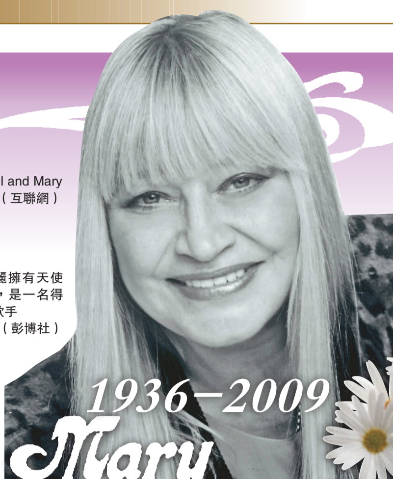
▶ 瑪麗擁有天使般的歌喉，是一名得天獨厚的歌手