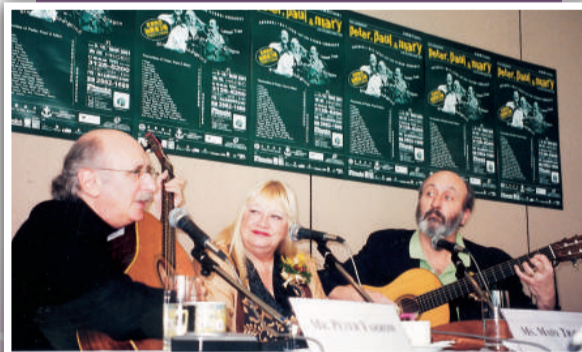
Peter, Paul and Mary 二〇〇一年來港演出，在記招上即席獻唱