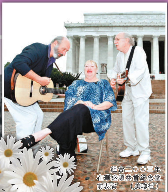
組合二〇〇三年在華盛頓林肯紀念堂前表演