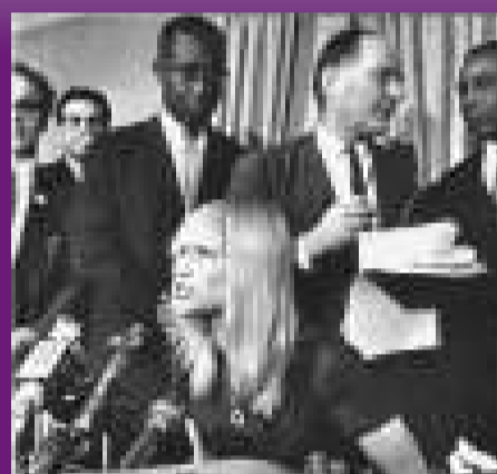
▲ 瑪麗於一九六七年出席紐約一個宣傳反戰的記者招待會

Peter, Paul and Mary 在一九七〇年解散，各自發展，但成績遠遠不及合作的時期。後來三人經常一同登台，更於二〇〇一年來港演出。二〇〇四年，所有演出因瑪麗患癌而暫停，瑪麗在手術後復出，近年登台數十次之多。今年五月在新澤西的演唱，成為了她的告別演出。