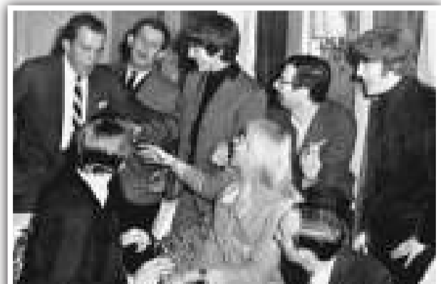
Peter, Paul and Mary 一九六四年在倫敦與後起之秀「披頭四」會面

一九六九年，他們憑《Peter, Paul and Mommy》最後一次奪得格林美獎。一九七一年，Peter, Paul and Mary 宣布拆夥，三人各自發展，但無法再取得合作時期那樣的成功。樂隊解散後，瑪麗推出過五張大碟。(綜合報道)