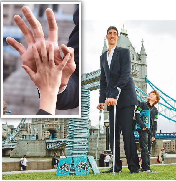
▲ 以克森的身高，他大概可以在姚明的頭頂上