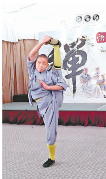
▲難道這位武僧是這樣坐禪？ (本報攝) ▲這位小僧人的搬腿功夫了得 (本報攝)