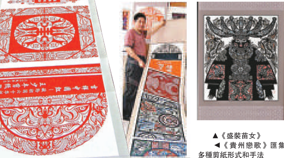
▲《盛裝苗女》 ▲《貴州戀歌》匯集多種剪紙形式和手法