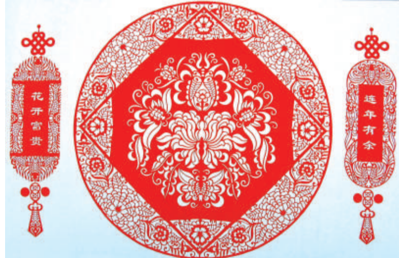
▲《吉祥中國紅》之《花開富貴》