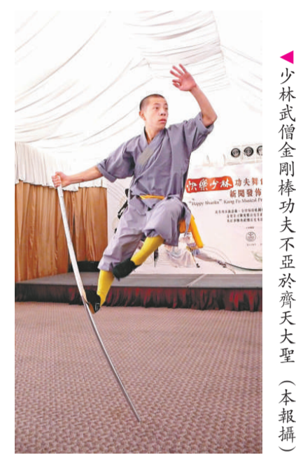
▲少林武僧金剛棒功夫不亞於齊天大聖

該劇花費了一千萬元投資，於香港首演後，將陸續往雲南、廣東甚至美國百老匯、歐洲等地巡迴，明年將於上海世博會演出個多月，整個巡迴的計劃有七至十年之長，而每到一地盡量會以當