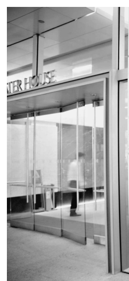
放置在中環遮打大廈門外的遮打浮雕

當年遮打的活動足跡並不限於中環一帶，他亦有參與堅尼地城和尖沙咀的土地發展，西環的吉席街便以他為名。尖沙咀原本有一條遮打街，紀念身為九龍倉創辦人之一的遮打，後來為免與中環的遮打道混淆，一九〇九年改為北京道。