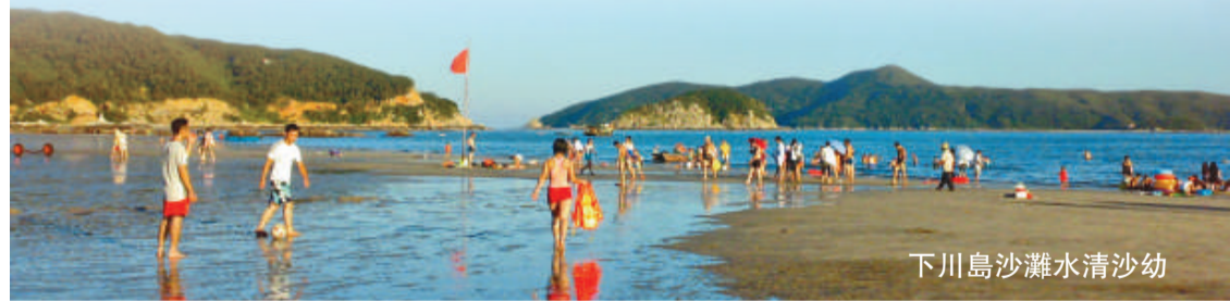
下川島沙灘水清沙幼

下川島位於上川島正南方向6海里處，與上川島遙遙相望，島的四周拱衛着茫洲、坪洲、水殼洲、山豬洲和王府洲等十四個小島嶼。在下川島的南澳灣，有一片天然生長的椰林，一般嶺南地區的椰樹都只長樹木不結果，而這裡的椰子樹則不同，不但每年掛果，且果實碩大，汁多味美；王府洲度假區內，有一條人工栽植的椰林大道，叫做「情人路」，路上椰影婆娑、綠意濃濃，來此旅遊的情侶們大都要在這條路上走上一遭，感受「海上綠島」帶