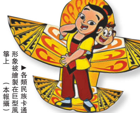
形象被繪製在巨型風箏上（本報攝）

風箏節組委會表示，在山東濰坊有著名的春季風箏會，而在上海的每年金秋十月，也有一年一度的上海旅遊節風箏會，今年的上海旅遊節第十二屆風箏會恰逢六十周年國慶佳期，所以特別策劃動漫結合民族的音樂動漫風箏節，選用最具有代表性的中國動漫形象作為主題風箏放飛於奉賢碧海金沙，希望能讓海內外遊客親身體驗中國民族體育文化的樂趣。這也是貫徹今年十月一日起實行的《全民健身條例》具體項目，此外，在十月二日至四日為期三天的《馬蘭花》音樂風箏節上還將有三台廣場音樂會為遊客助興。