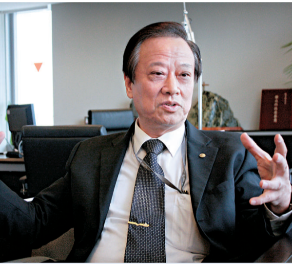
外傳歐晉德將接替殷琪擔任高鐵路董事長（資料圖片）

台北國際發明暨技術交易展記者會21日展出多項從「人性」角度開發的新科技。中央大學研發的機器小熊透過攝影機就可學人動作，大秀「SORRY」舞姿。（中央社）