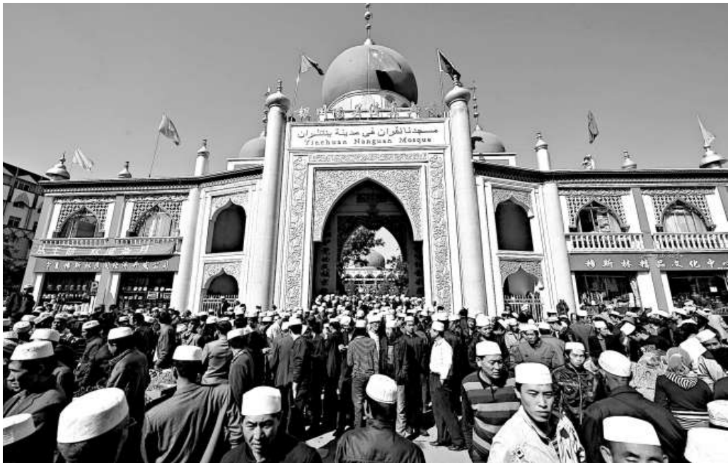
21日，穆斯林群眾在寧夏銀川南關清真大寺舉行聚禮，歡度開齋節

白皮書表示，針對全疆1000多萬少數民族人口中約70%尚未掌握或根本不懂漢語文字，對少數民族和自治區發展造成不利影響的情況，自治區政府於2004年作出在少數民族學生中大力推進「雙語」教學的決定，要求少數民族學生高中畢業時達到「民漢兼通」的目標。