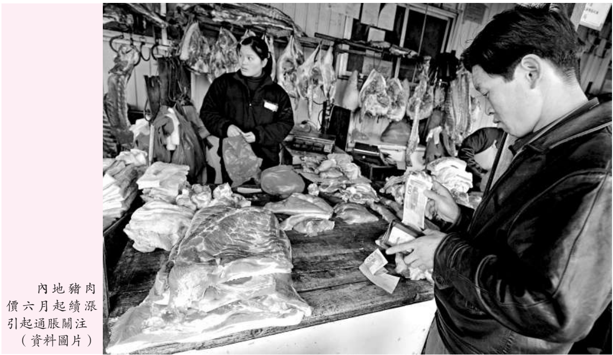
內地豬肉價六月起續漲引起通脹關注（資料圖片）

上午8時許，記者在銀川西環清真大寺看到，這裡的穆斯林有的忙着寫標語，有的登高插彩旗。「慶祝開齋節」等醒目的橫幅掛在清真寺最醒目的大殿中央。據了解，今天在寧夏的各個地區有200多萬穆斯林群眾分別在3400多座清真寺舉行節日會禮。