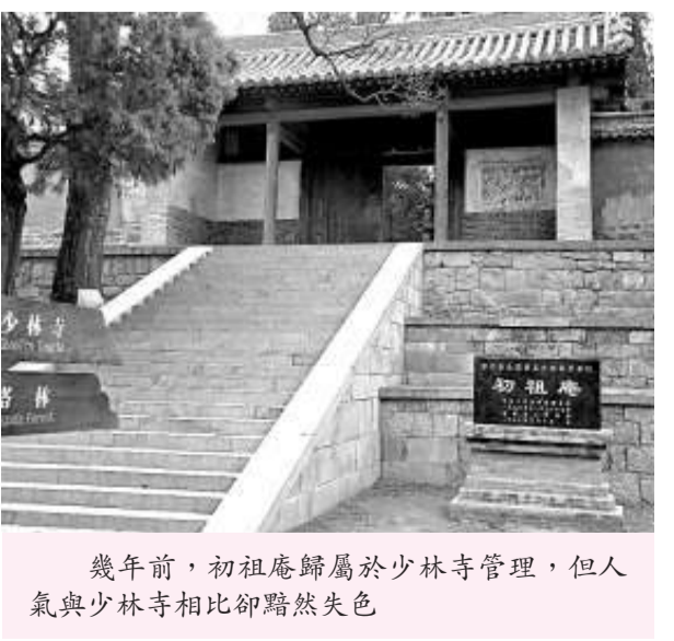
幾年前，初祖庵歸屬於少林寺管理，但人氣與少林寺相比卻黯然失色

年輕女尼的臉上，泛著少女特有的紅暈，體態豐腴，如一朵初出水面的芙蓉，含苞欲放。不知道她因何而