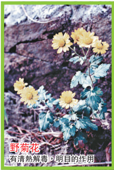
野菊花 有清熱解毒，明目的作用

野菊花 (Dendranthema indicum) 為菊科菊屬多年生草本，莖直立或斜舉，有分枝，常被白色短柔毛，葉互生卵形，羽狀深裂，葉面被疏柔毛，下面被短柔毛，頭狀花序頂生，舌狀花淡黃色，管狀花深黃色。以花或全草入藥，對防治感冒、流感，及治療疔瘡腫毒、高血壓等可起清熱解毒，涼血降壓的作用。