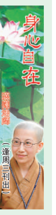
身心自在 (逢周三刊出)