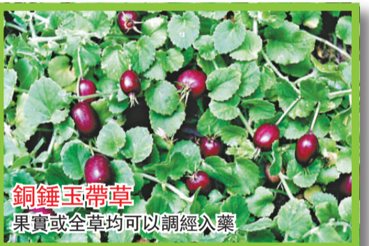
銅錘玉帶草 果實或全草均可以調經入藥

桔梗科銅錘玉帶草屬的一年生伏地草本，莖纖細，呈圓柱形，節上生根，葉互生，心形，葉面綠色，背面帶紫色，有疏毛，邊緣有鋸齒，有葉柄，花小，單生葉腋，花梗長，色紫紅，漿果長橢圓形，成熟時色紅。此植物之果實或全草均可入藥，有祛風利濕，活血散瘀之效，主治風濕疼痛，月經不調等症。