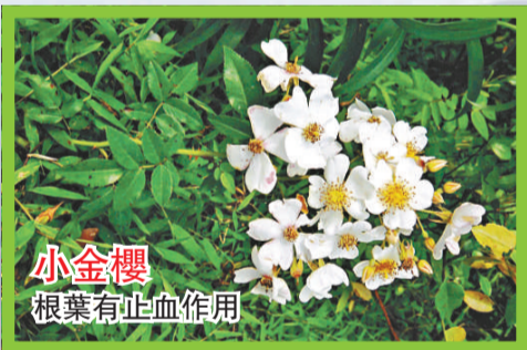
小金櫻 根葉有止血作用

小金櫻 (Rosa henryi) 薔薇科薔薇屬攀援灌木，枝條帶紫紅色，具鉤狀皮刺 (花枝無刺)，羽狀複葉，呈橢圓形或卵狀橢圓形，先端漸尖，基部渾圓，邊緣有銳鋸齒，托葉窄，附着於葉柄，傘房花序，頂生，花色白，氣味芬芳，花梗上散生腺毛，萼裂片，呈卵狀，披針形，有柔毛，果呈球形，細小，成熟時暗紅色。藥用根葉，有收斂止血，解毒消腫的作用，常用於月經過多，風濕關節痛及跌打損傷等。