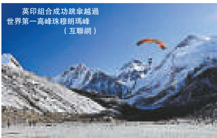
英印組合成功跳傘越過世界第一高峰珠穆朗瑪峰

牠跟蜘蛛俠如此相像，這令人感到不可思議。雖然牠不會吐絲，但爬牆行走卻是牠的強項。 (綜合報導)