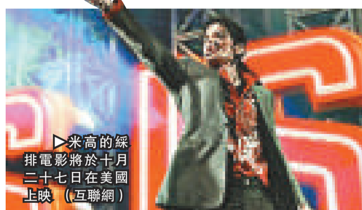
▶米高的綜排電影將於十月二十七日在美國上映 (互聯網)

這部電影是由百多小時的幕後片段剪輯而成，米高在片中排演了多首歌曲。 (英國《每日電訊報》)