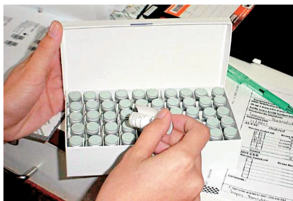
最新的愛滋病疫苗

此後，各國研製愛滋病疫苗的腳步從未停止，但遺憾的是，一直沒有令人振奮的消息。尤其去年九月，被公認為最有希望獲得成功的一項愛滋病疫苗實驗宣告失敗，注射疫苗的一組人群感染比例甚至略高於未注射組。