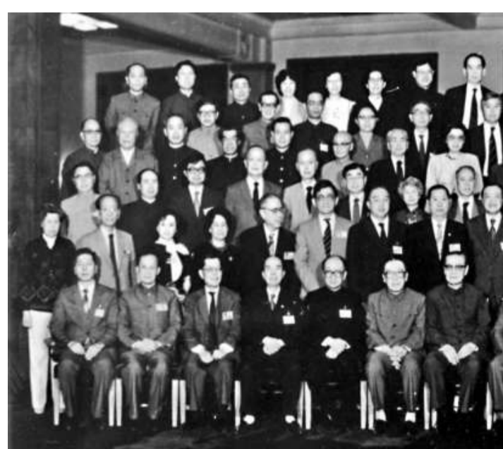
▲黨和國家領導人一九八五年與古勝祥等出席中國人民政治協商會議六屆三次會議的全體委員合照