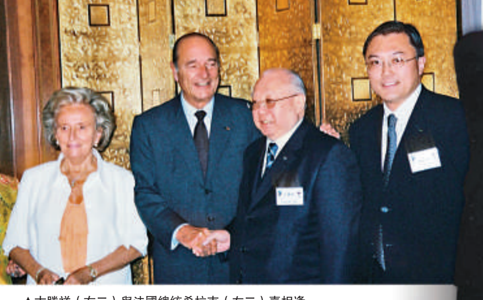
▲古勝祥（右二）與法國總統希拉克（左二）喜相逢