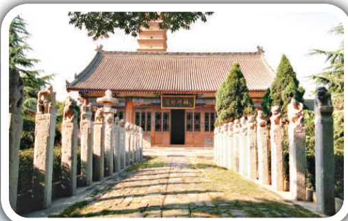
價值連城的石質書庫——蒲城碑林