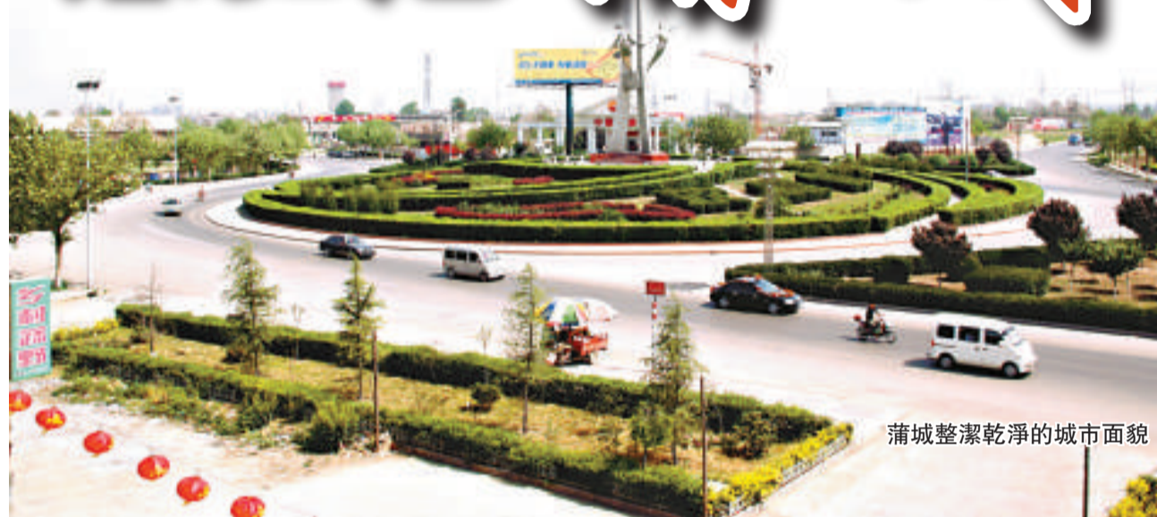
蒲城整潔乾淨的城市面貌

地處關中平原東北部的陝西省蒲城縣，夏商屬雍州，周封賈國，春秋屬晉，秦置重泉，北魏名南白水，西魏始稱蒲城，唐名奉先，宋後改歸蒲城至今，其歷史不可謂不悠久。蒲城距古城西安90公里，幾千年的歷史成就了如今蒲城境內的文物薈萃，歷史人物眾多，也成就了今日蒲城的大氣和智慧的人民。建國60年，蒲城縣經過了大發展，大跨越，如今已有「中國花炮之鄉」和「中國酥梨之鄉」的美譽，經濟社會更是又好又快地加速向前發展。