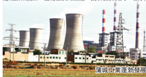
蒲城工業蓬勃發展

蒲城的領導者深知，發展工業經濟是發展縣城經濟的基礎，而工業園則是現代工業發展的重要載體，是發展現代工業優化資源配置的有效途徑。近幾年，蒲城縣依託資源優勢，堅持以推進傳統工業向現代工業跨越發展、推進城鎮和園區一體化發展為重點，創新發展模式，培育特