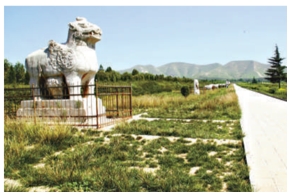
雄偉的唐睿宗橋陵

觀年間的文廟仍默默坐落在縣城正街上，廟前有一座保存完好的六龍壁，始建於明萬曆四十四年（公元1616），高6米，長17米，為琉璃花磚精砌而成，生動而富有靈氣。收藏有上至北魏，下至民國時期的240餘通碑石、經幢的蒲城碑林，則是價值連城的石質書庫，這裡有《北魏觀世音寫經》，也有全國百通名碑之一的《雲麾將軍碑》，更有國家一級文物高力士神道碑、唐玄宗為4個妹妹寫的神道碑等。蒲城還擁有陝西唯一保存完好的清代考院，正在院內籌建博物館，該館建成後將成為我國第一座以清代科舉考試用具、考試試卷等文物為專題陳列的博物館。