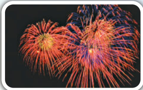
蒲城焰火，中華一絕