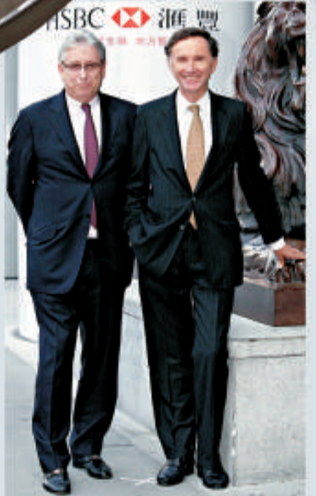
▲滙豐主席葛霖（右）與行政總裁紀勤