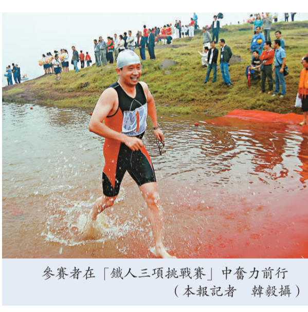
參賽者在「鐵人三項挑戰賽」中奮力前行

據悉，中國婦女兒童博物館建築面積約3.56萬平方米，展陳面積約0.8萬平方米，內設古代婦女館、近代婦女館、當代婦女館、國際友誼館、女性藝術館、女性服飾館、古代兒童館、近代兒童館、當代兒童館、兒童玩具館、兒童體驗館等11個固定展館。該館將於今年底向公眾開放。(新華社)