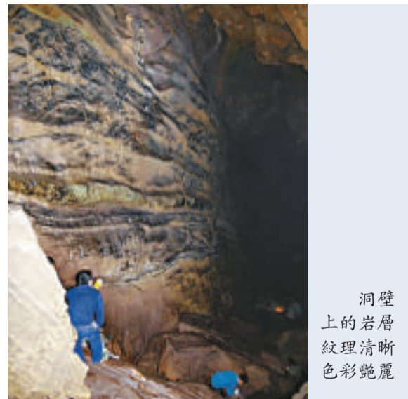
洞壁上的岩層紋理清晰色彩艷麗

景區規劃有龍潭峽景區、動物園區、科研啓智區、昭君親水休閒區四個主要景點，一個自然博物館，一個珍稀植物保護園。現正在建設的內容包括景區景點建設、景區景點配套建設和配套基礎設施建設等，總投資三億元，預計於明年「五一」開放。