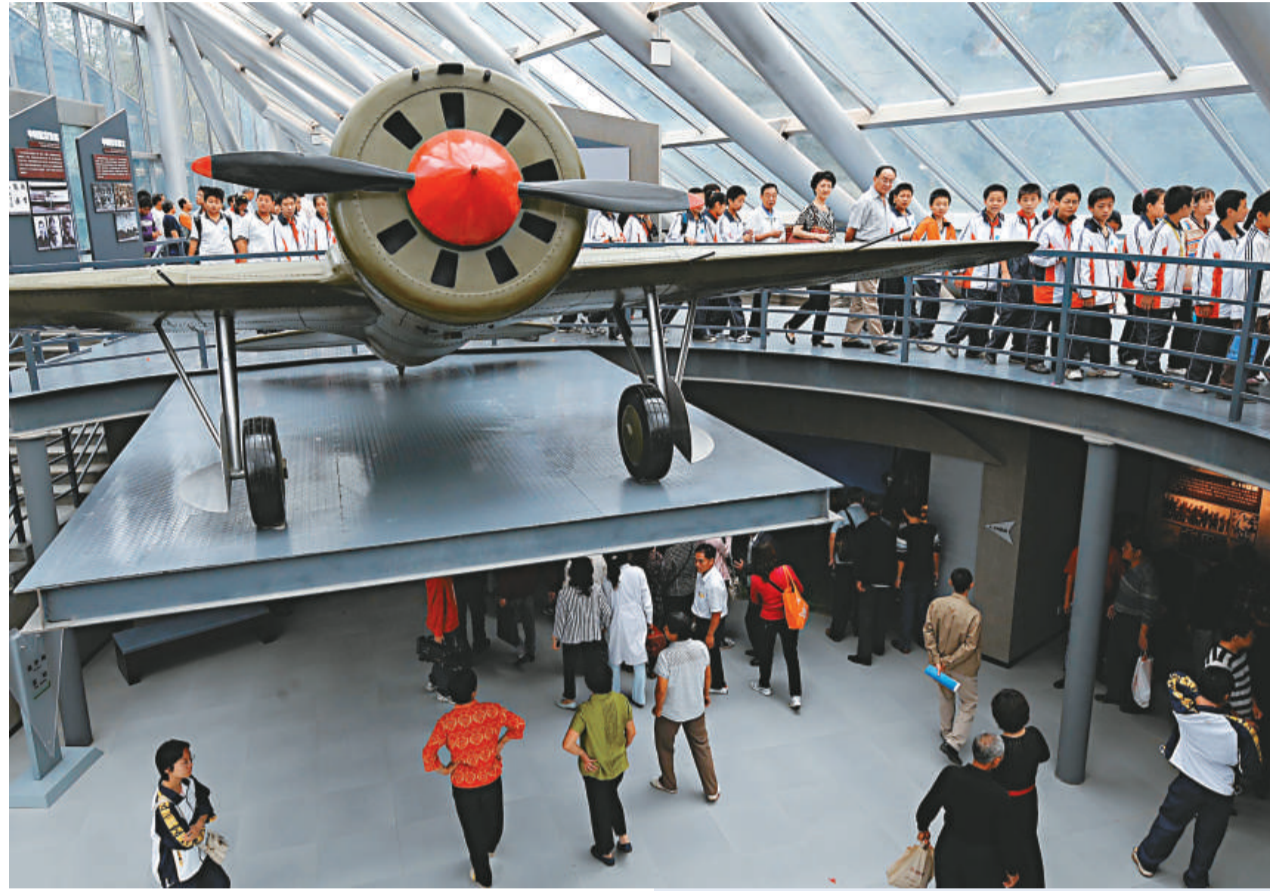
▲南京抗日航空紀念館昨天開館。圖為公眾和學生們在紀念館內參觀

在「抗館」的四個室內展區，第一、二展區為一個整體展區，一館的「奮勇抗戰」全面反映了1932年春中國空軍首次投入抗擊日軍的淞滬抗戰，和1937年至1945年8月間全面投入抗日空戰情況，二館的「國際援華」展示了在抗戰期間，國際航空援華情況，據統計，有200多名蘇聯飛行員、2000多名美國航空人員及兩名韓國飛行員在中國