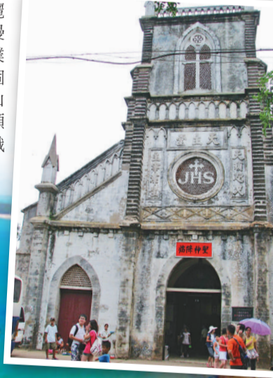
▲瀾洲島盛塘天主教堂 ▲俯瞰瀾洲島港灣

走過整個瀾洲島或許要兩三日的時間，走馬觀花式的遊玩是不適宜這裡的，瀾洲島就像一個純樸美麗的漁家少女，只有慢慢的了解才能發現她質樸純真的美，瀾洲島這個中國最大最年輕的火山島就像北台灣中的一顆珍珠，靜靜的等待著識寶者來開拓。