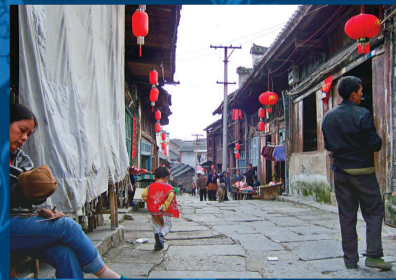
▲龍潭的大街小巷多是清一色的石板路