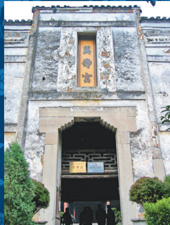
▲「萬壽宮」是龍潭古鎮的標誌性建築

我們沿另一條路返回，洞的出口處很寬敞，在導遊的指點下，看到洞頂有幾個凹巢，灰色的崖壁上透出幾點黑色，導遊說，這就是神秘的古懸棺葬，裡面放著棺材，據考證這些棺材年代久遠，最早的是宋代。