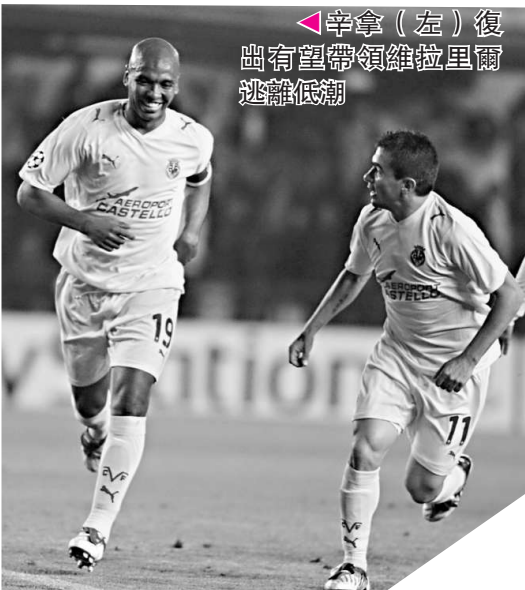
辛拿(左)復出有望帶領維拉里爾逃離低潮

而這個「長期」究竟有多長？按安察洛堤目前的打算顯然超不過6年。「我想我（執教）的終點在2015年。」