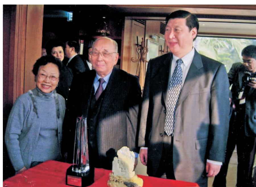
▲查氏夫婦與習近平副主席合影

三是在家鄉及一些貧困地區捐建中學及大學，培育人才。查先生深信，只有教育和科技才可以真正令國家富強。