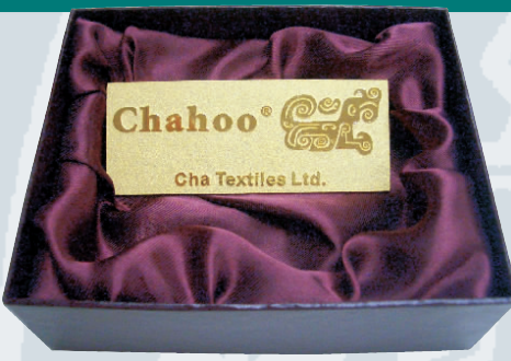
▲查氏紡織的「查虎」標誌成為神六返回贈答禮物之一