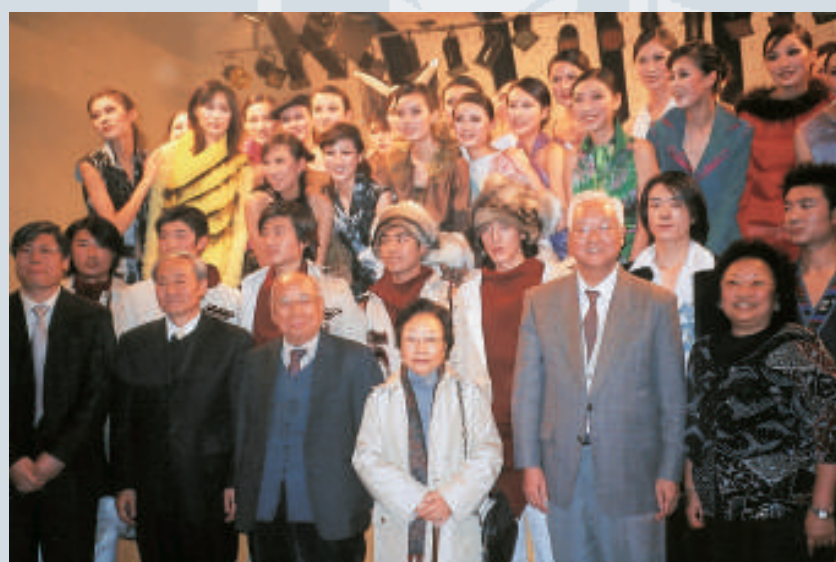
▲桑麻頒獎禮每年在不同的大學舉行