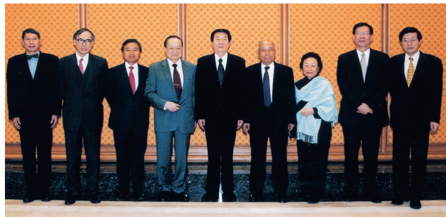
▲查氏夫婦偕旗下名力集團董事拜會朱鎔基總理