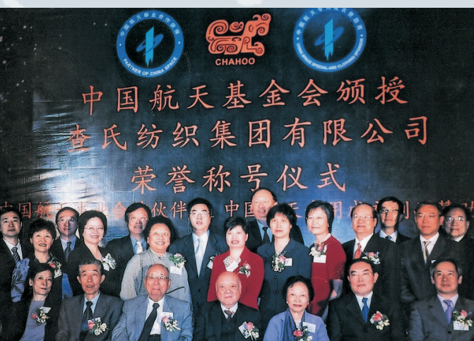
▲查氏紡織集團成為「中國航天」及「航天專用成衣」合作夥伴