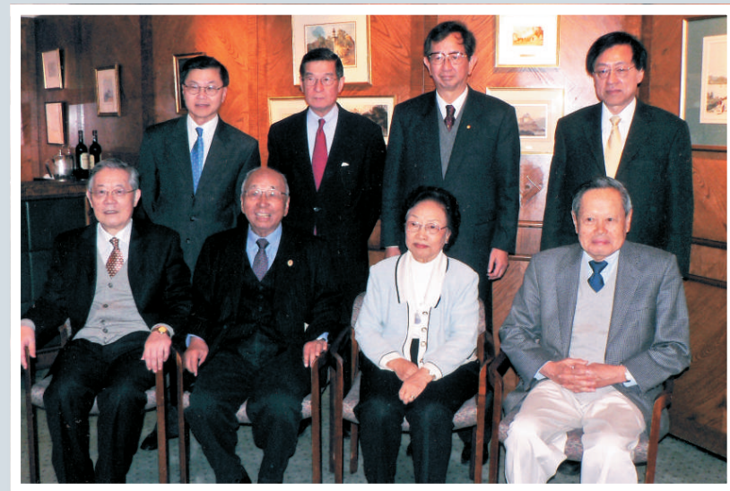
▲求是科技基金會創辦人及顧問：（前左起）周光召、查濟民、劉璧如、楊振寧，（後左起）何大一、簡悅威、李遠哲、姚期智