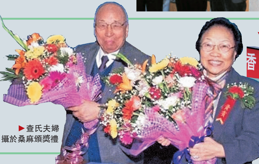
▲查氏夫婦攝於桑麻頒獎禮