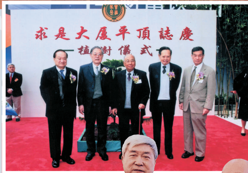
▲深圳求是大廈平頂儀式，（左起）查良鏞、周光召、查濟民、楊振寧、簡悅威