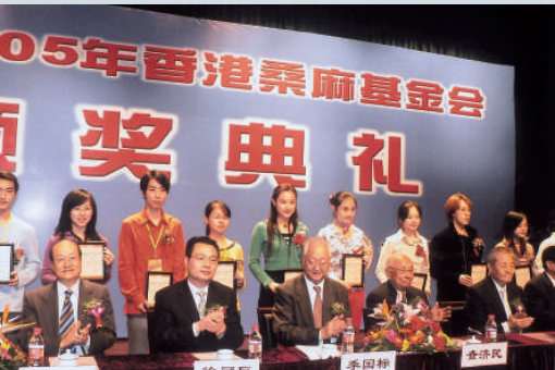
▲桑麻基金鼓勵年輕人投身紡織業