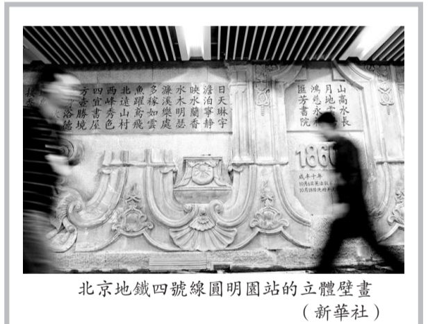
北京地鐵四號線圓明園站的立體壁畫