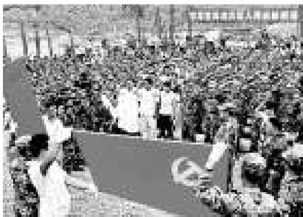
《決定》對加強和改進黨的建設作出了具體部署（資料圖片）

值得關注的，此次中央選特別提出，將加大治懶治庸力度。這也是中央一級黨建文件首次鮮明地提出這方面舉措。中央要求，着力解決幹部管理不嚴問題，並切實解決幹部能上不能下、能進不能出問題。嚴格按照領導職數配備幹部，切實解決違反規定超職數配備幹部問題。對幹部存在的苗頭性問題早發現、早提醒、早糾正。