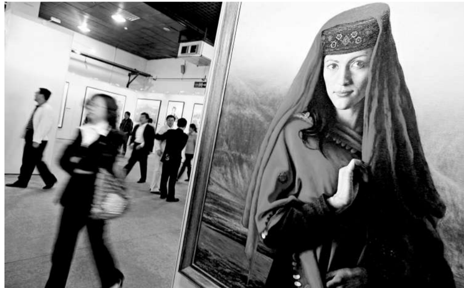
「新疆維吾爾自治區慶祝中華人民共和國成立60周年攝影美術集開展」在新疆舉行，眾多作品展現了新疆取得的豐碩成果和民族團結的大好局面

【本報訊】新疆維吾爾自治區十一屆人大常委會第十四次會議日前閉幕，會議審議並通過了《自治區信息化促進條例》地方性法規，該條例有針對性的制訂了關於禁止利用信息網絡實施七種行為的規定。