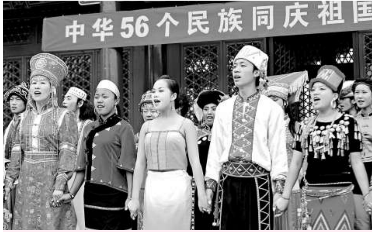
白皮書指出「民族平等，是中國民族政策的基石」。圖為二十五日，來自全國各地的少數民族演員在北京中華民族園齊唱《歌唱祖國》

白皮書指出，為妥善處理影響民族團結的矛盾和問題，中國堅持團結、教育、疏導、化解為主的方針，具體問題具體分析，是什麼問題就解決什麼問題，避免事態擴大和矛盾激化。「國家維護法律尊嚴，維護人民利益，凡屬違法犯罪的，不論涉及哪個民族、信仰何種宗教，都依法處理。」