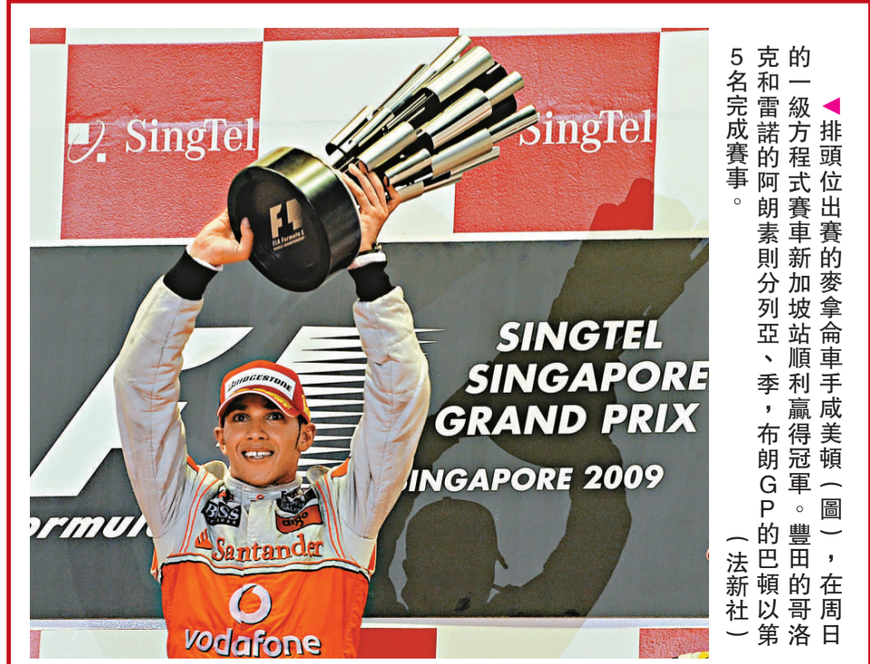
排頭位出賽的麥拿拿車手威美頓(圖)，在周日的一級方程式賽車新加坡站順利贏得冠軍。豐田的哥洛克和雷諾的阿明素則分別列亞、季，布明G P的巴頓以第5名完成賽事。

總共2層的展廳中，不但設有環幕影院以及大量有關奧林匹克運動的圖片展覽，還有中國唯一一家可以經營國際奧林匹克和歷屆奧運題材紀念品的特色商店。博物館由國際奧委會委員吳經國多年籌劃創建，吳經國親任館長。