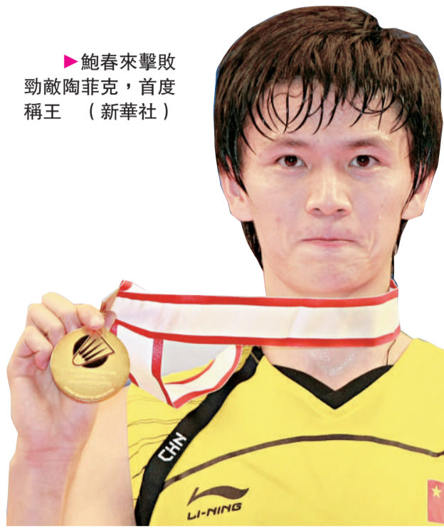
鮑春來擊敗勁敵陶菲克，首度稱王