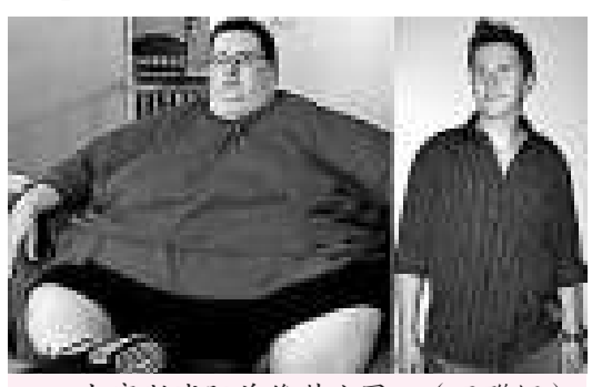
史密斯減肥前後對比圖