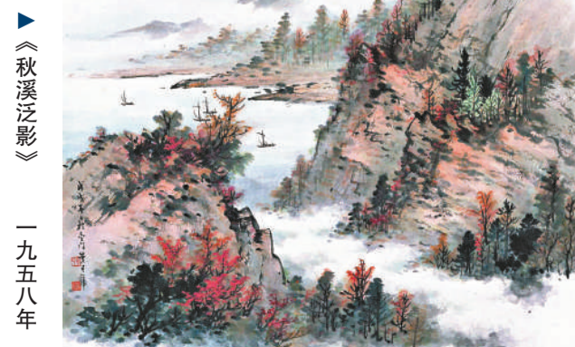
《秋溪泛影》一九五八年