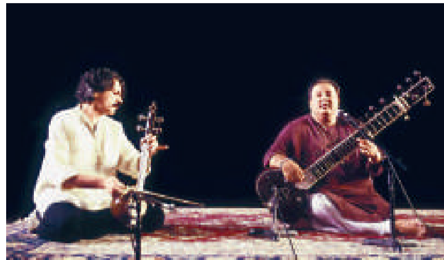
▲伊朗古典四弦提琴演奏家 Kayhan Kalhor (左) 和西塔爾琴演奏家及歌唱家 Shujaat Husain Khan，將來港演繹「格札爾」

Shujaat Husain Khan 經常在印度各大音樂節演出，樂蹤遍及亞洲、歐洲及