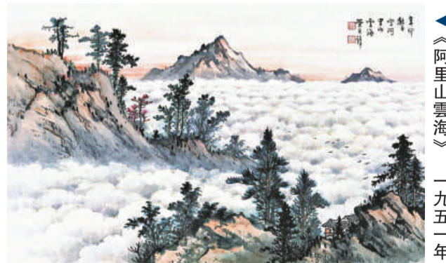
《阿里山雲海》一九五一年