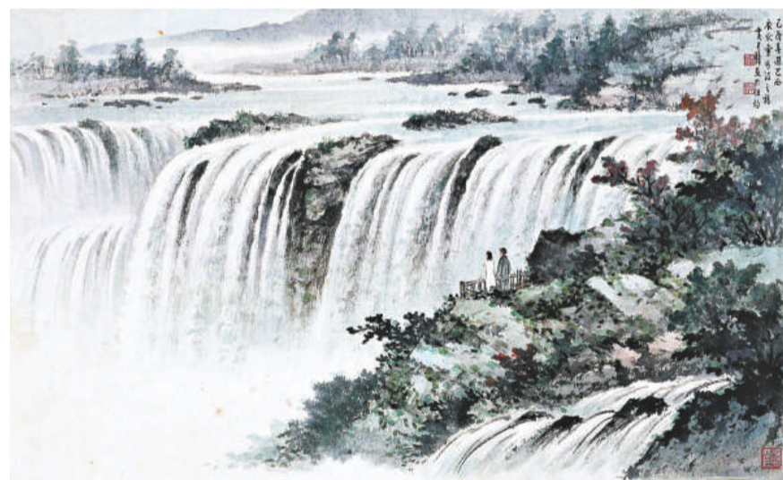
《松崖聽濤》一九五七年