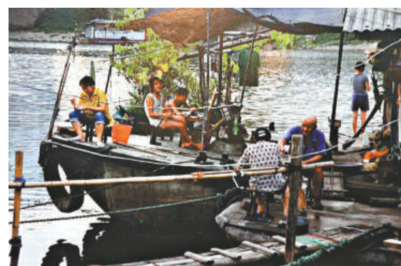
孫蕭紋《城河岸邊的幸福人家》