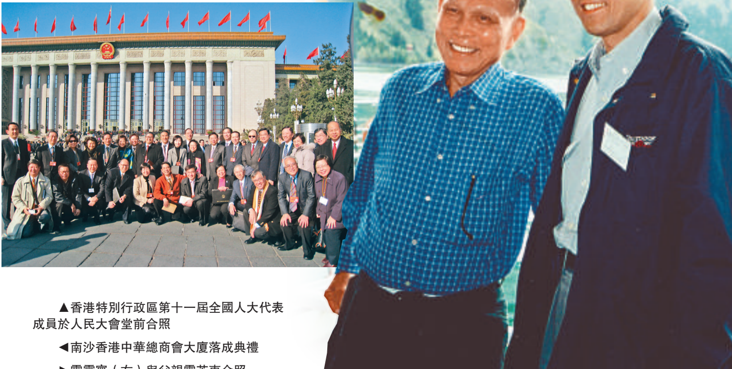
▲香港特別行政區第十一屆全國人大代表成員於人民大會堂前合照 ▲南沙香港中華總商會大廈落成典禮 ▲霍震寰（右）與父親霍英東合照