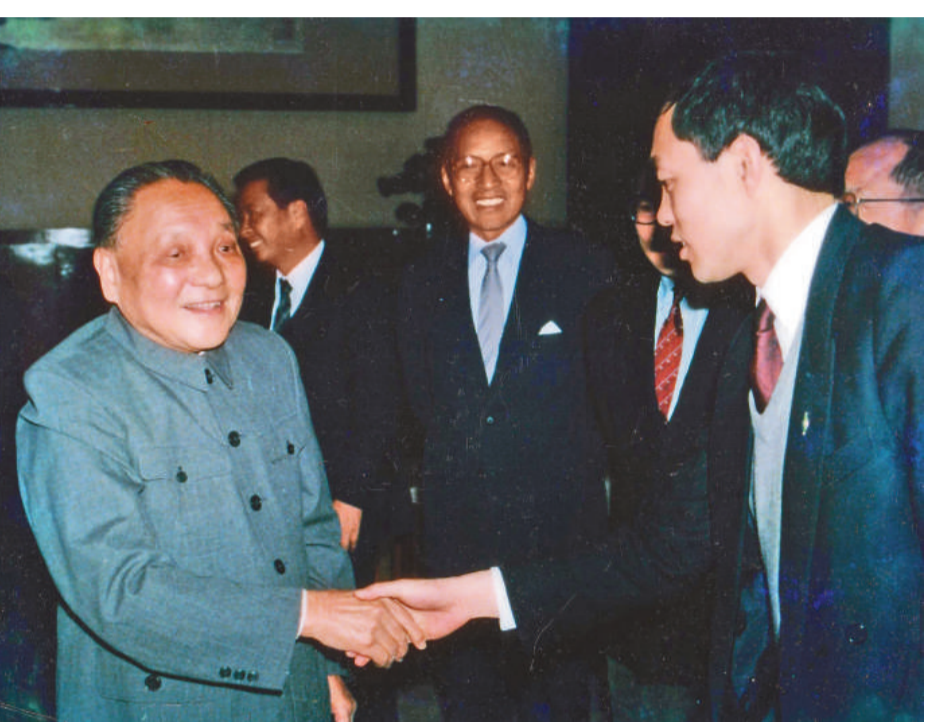
▲國家主席胡錦濤與霍震寰交談甚歡，鄧小平與霍震寰親切握手。