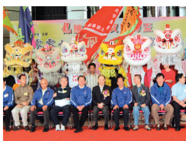
▲2007全港公開龍獅賽開幕禮