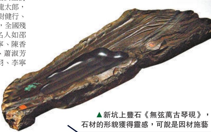
新坑上豐石《無弦萬古琴硯》，由石材的形貌獲得靈感，可說是因材施藝