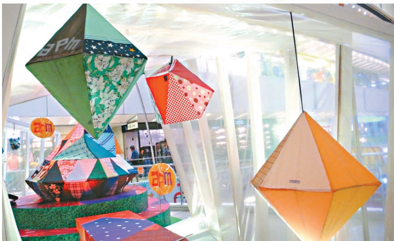
不同形狀的燈籠，圖案顏色柔和

由於這次用的雨傘布數量很多，差不多已把她家中的雨傘布存貨用光，所以一來到香港，井上萌子便急不及待看看有沒有拾雨傘的機會。井上萌子說：「香港的雨傘，有好多都是防UV，同時是銀色布質，雖然日本有防UV的雨傘，一般都不會用銀色布質。當然，現在日本人所用的雨傘，大部分都是中國製造的呢。我們日本人用雨傘時分得很清，會分別專門用擋太陽及遮雨用的