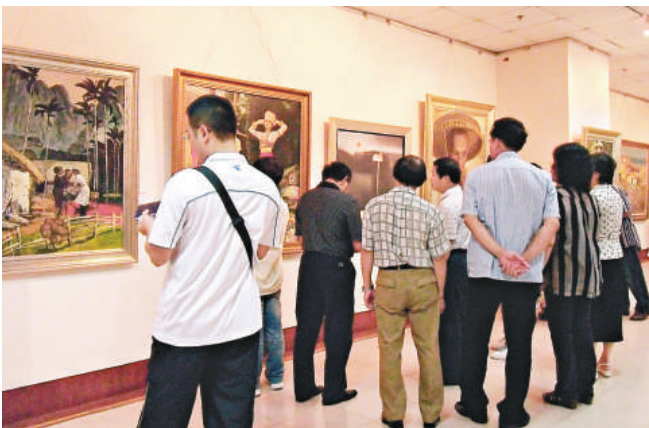
觀眾在展場參觀畫展