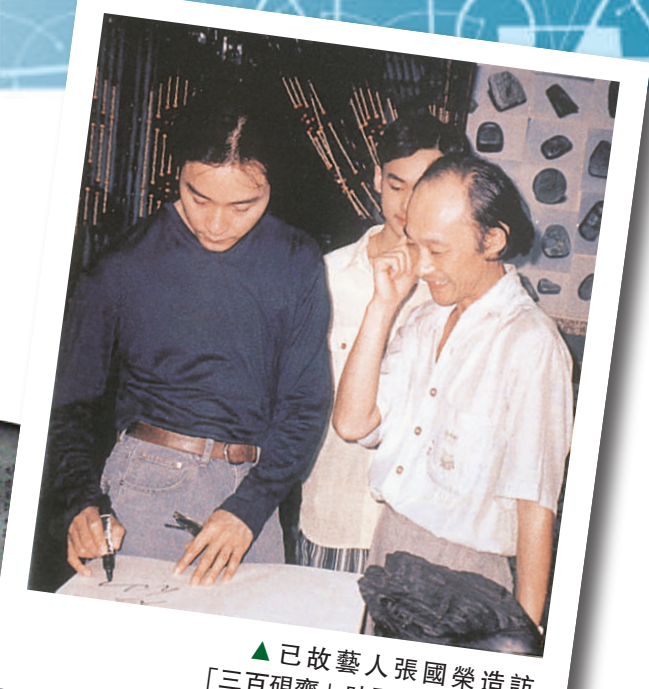
已故藝人張國榮造訪「三百硯齋」時題字

至於《歙之國寶》三百硯齋資料選輯，則以圖文並茂的形式，記載了三百硯齋的發展，當然少不了其「威水史」，如前國家主席江澤民也親往三百硯齋參觀，還有國家副主席習近平、國務院副總理回良玉、全國政協副主席董建華夫婦、新加坡內閣資政李光耀、泰國公主詩琳通、前日本首相橋本龍太郎，還有李嵐清、錢其琛、尉健行、李鐵映、唐家璇等高官，全國殘聯主席鄧樸方，各界名人如邵逸夫、饒宗頤、楊振寧、陳香梅、張國榮、葉國華、蕭淑芳、賴少其、范曾、喬羽、李寧