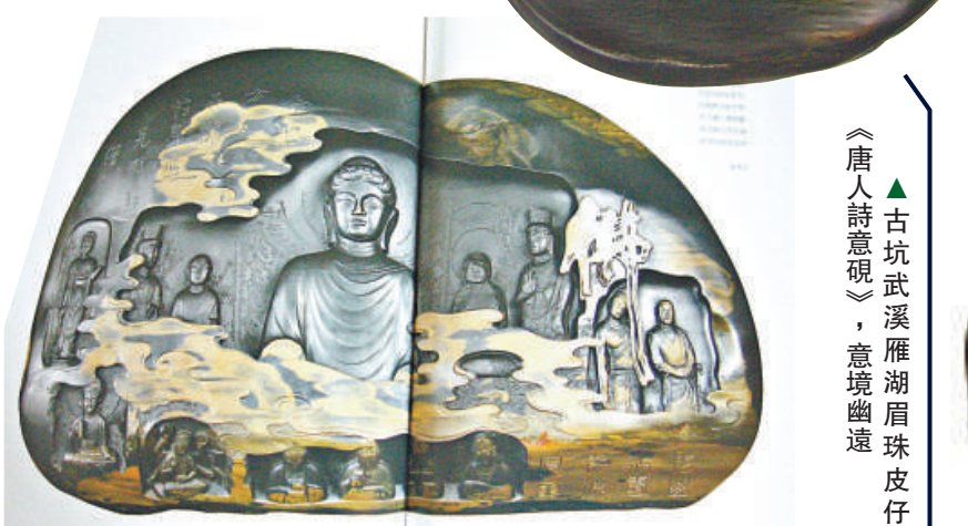
新坑金量《石佛硯》，似乎把整座龍門石窟也「搬」進歙硯中