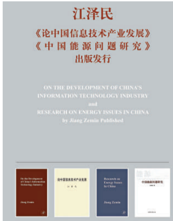
江澤民學術著作英文版封面

作為最大的省市展團之一，上海出版界此番以「閱讀上海、走近世博」為主題，首次由上海市新聞出版局統一率領38家出版社組團參展，並由政府承擔一半的場租費用。總計帶去世博圖書73種、版權貿易圖書255種，「文化中國」系列叢書180種。