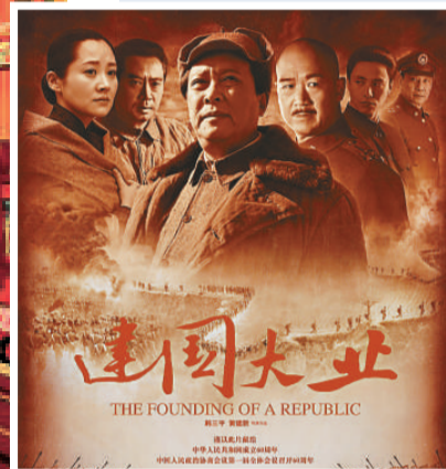
電影《建國大業》大收旺場（資料圖片）

其次，金融危機會降低投資生產創作的成本，非常有利於文化產品的發展。而消費成本的降低，也進一步增強文化產品的吸引力。另外，金融危機也使一批投資者重新調整投資計劃，促使一些地區調整產業結構，轉向消耗物質財富低的文化產業。從這個意義上講，文化產業當前的發展機遇是很多的。