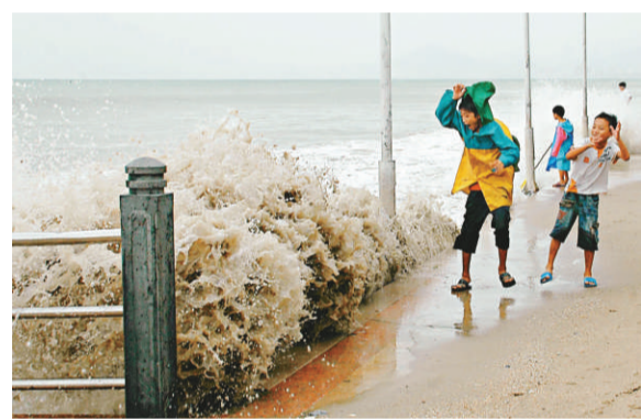
29日，遊人在三亞灣海月廣場海邊觀浪