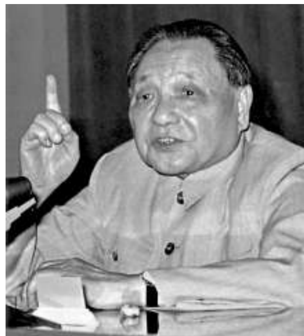
▲鄧小平和表弟淡文全雖是親戚關係，但兩人從沒見過面