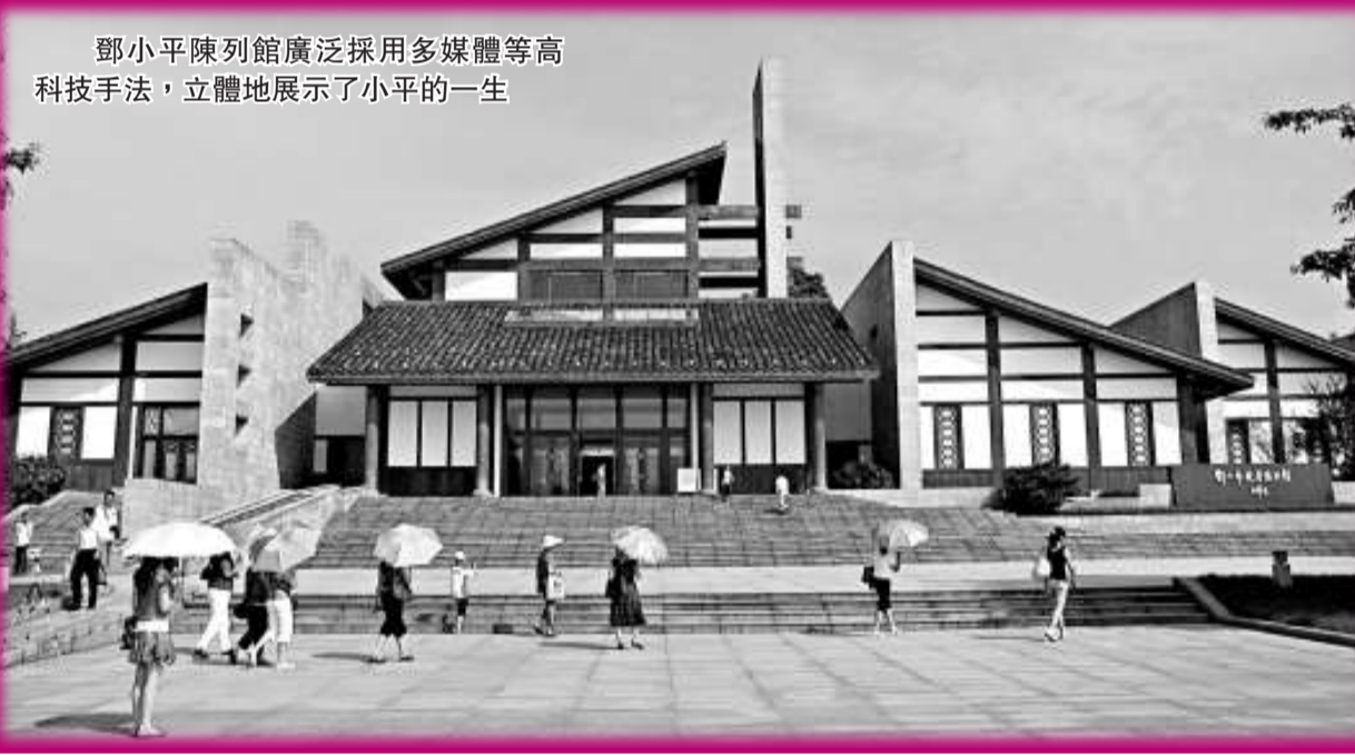
鄧小平陳列館廣度採用多媒體等高科技手法，立體地展示了小平的一生