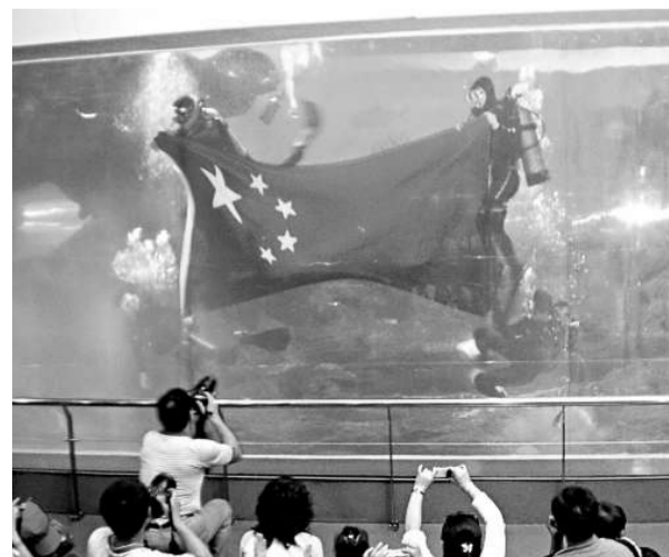
為慶祝建國60周年，在山東省青島市海底世界大水体裡，四名潛水員護送一面鮮艷的五星紅旗在水底「升起」，與現場的遊客一起共賀祖國生辰。

29日上午，文化部長蔡武在「新中國成立60年來特別是改革開放30年來中國文化事業的發展成就」新聞發布會上表示，中國文化市場消費增加很快，電影票房節節攀升。他說：「《建國大業》公演三天時間，票房已經突破2.5億元，人們看電影的熱情非常高。」他又指出：「今年元旦春節期間，國家的文化市場消費增加很快，電影票房節節攀升，國產動畫電影《喜羊羊與灰太狼之牛氣沖天》票房突破了將近9000多萬元。」（中新網）